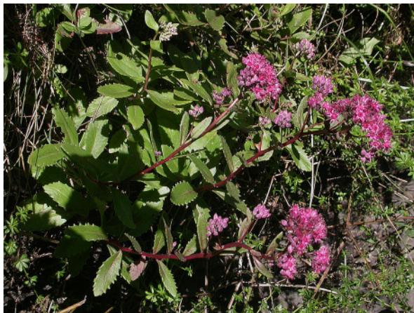
Abb. 2: Hylotelephium vulgare, Rurtal bei Widdau, Kreis Aachen/NRW, 5403/24 (29.08.2005,).