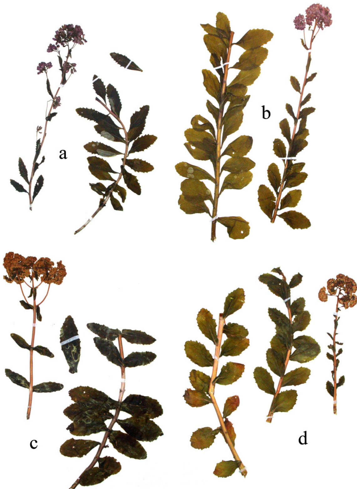
Abb. 7: Herbarbelege der Hylotelephium telephium -Gruppe:

a) Hylotelephium vulgare , Widdau, Kreis Aachen/NRW, 5403/24 (29.08.2005)