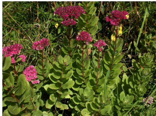
Abb. 3: Hylotelephium telephium, Gemünd-Kirchberg, Kreis Euskirchen/NRW, 5405/13 (04.09.2005,)