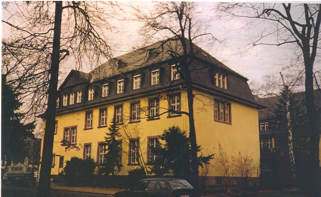
Institut für Medizinische Soziologie Haus 10, Etage im 1. Stock Im Universitätsklinikum Frankfurt a. M.