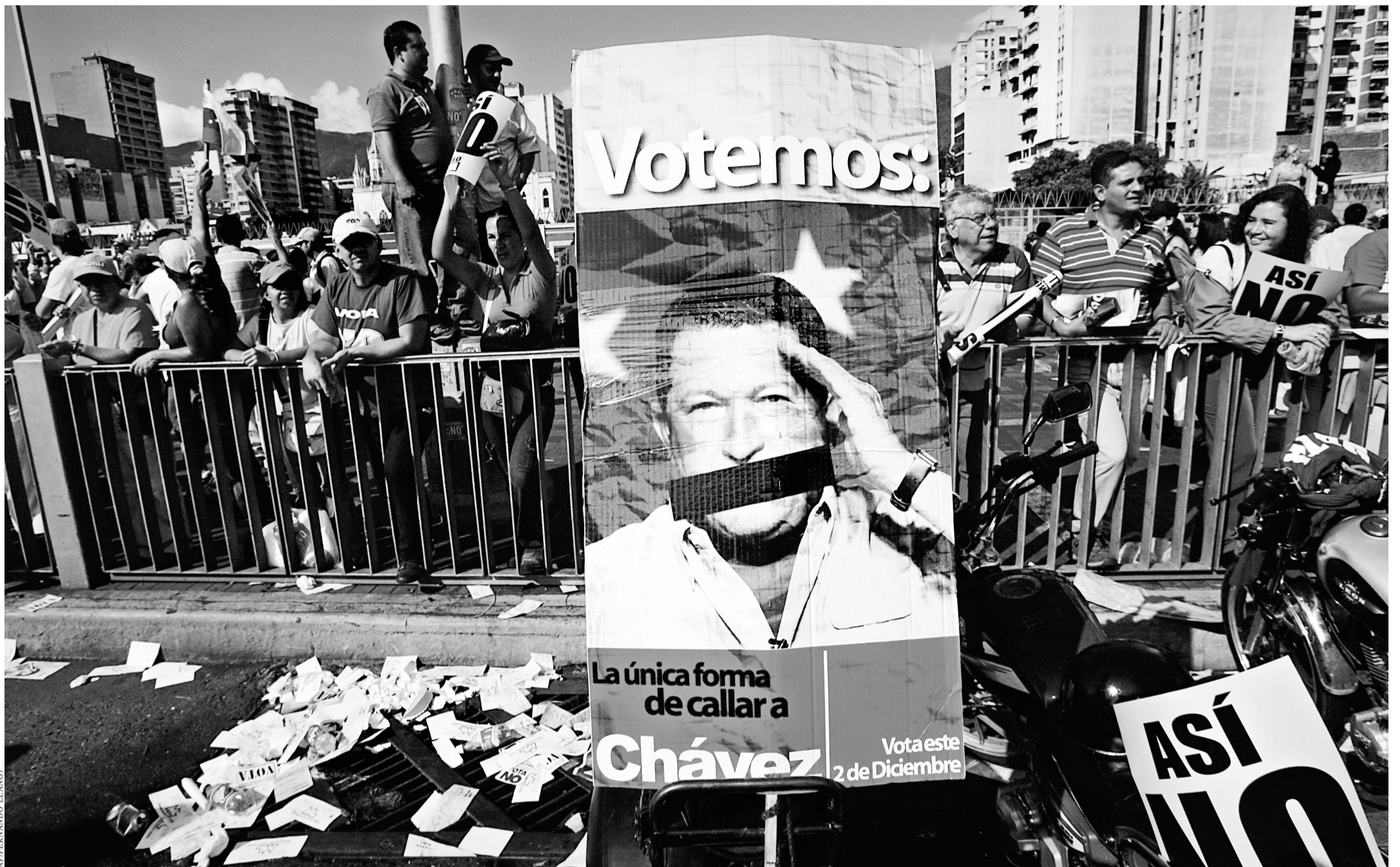
Stimmung gegen Präsident Hugo Chávez in Caracas. Parallel zum Aufbau einer Gegenbewegung versuchen kolumbianische Contras, die Hauptstadt von zwei Seiten in die Zange zu nehmen (29.11.2007)