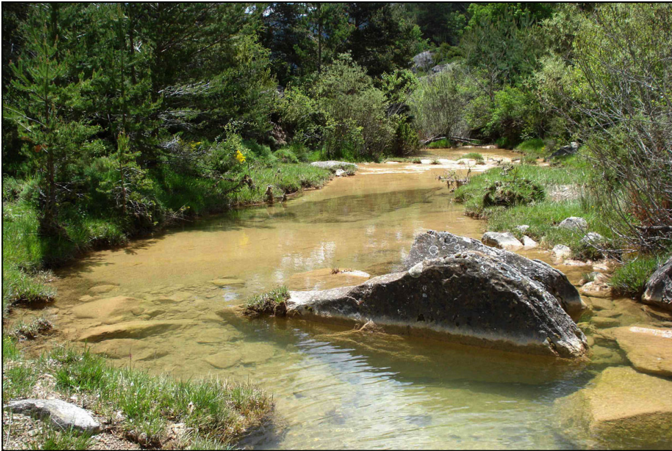
Foto 1: Barranco de Nocito (provincie Huesca), een vrij ondiepe kalkrijke beek met wat overhangende beschaduwde oevers, en ondiepe luwten met zachte bodem, goed voor oa Boyeria irene , Onygomphus forcipatus , Pyrrhosoma nymphula , Orthetrum brunneum , Cordulegaster boltonii .