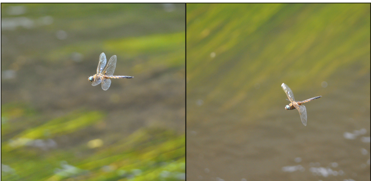
Foto 1: Bijzonder interessante vliegbeelden: Tweevlek, gefotografeerd aan brug in Lamorteau.

Aan de eerste plas die we uitgekozen hadden, namen we slechts een Gewone Keizerlibel ( Anax imperator ) en wat Grote roodoogjuffers ( Erythromma najans ) waar. Onderweg naar de volgende plassen kwamen we nog wel Glassnijder ( Brachytron pratense ) en Grote vuurvlieder ( Lycaena dispar ) tegen. Eens aangekomen bij de eerste plas, bleken hier naast nog meer Glassnijder ook een viertal individuen van Tweevlek te vliegen. Misschien is er dan toch een kleine populatie Tweevlek in de Gaume? Het aantal waarnemingen van de soort in de Gaume valt op één hand te tellen. Alhoewel we nog enkele plassen afspeurden werden er geen meer gezien. Wel werden er nog een hoop andere leuke dingen als Mercurwaterjuffer ( Coenagrion mercuriale ), Zuidelijke bronlibel en een resem dagvlinders waargenomen. Het weekend nadien hebben Ward Verdecruysse en Simon Feys nog meer Tweevlek waargenomen op diverse andere