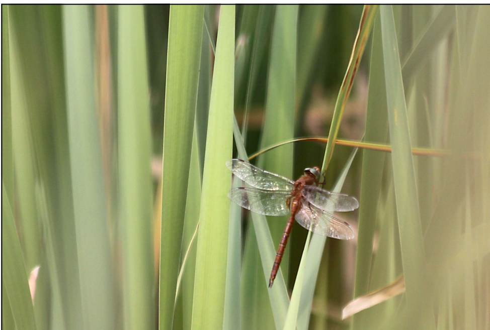
Foto 1: Vroege glazenmaker in het Hageven op 14 augustus 2010.

Op 14 augustus 2010 merkte ik rond 17.30 een mannetje Vroege glazenmaker ( Aeshna isoceles ) op, aan één van de heringerichte vijvers net ten noorden van het bezoekerscentrum de Wulp in het natuurreservaat Het Hageven te Neerpelt. Het dier kon gedurende ruim 45 minuten geobserveerd worden. Hierbij ondernam het regelmatig patrouillerende vluchten boven het water om zich nadien voor langere tijd neer te zetten op een van de stengels of bladeren van Riet ( Phragmites australis ) en lisdodde ( Typha ). Tweemaal zag ik het mannetje even verdwijnen van bij het water om luttele minuten later opnieuw te verschijnen. De aanleiding hiertoe was duidelijk territoriale conflicten met andere libellen, ondermeer met Paardenbijter ( Aeshna mixta ) en heidelibellen ( Sympetrum spec. ), vermoedelijk Bruinrode heidelibel ( Sympetrum striola-