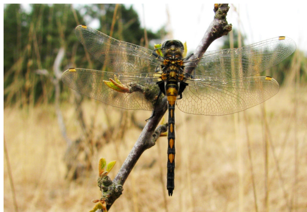
Foto 1: Noordse witsnuitlibel, de belangrijkste libel op de excursie naar de Kalmthoutse Heide op 25/04/2010.