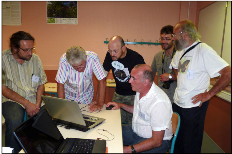
Foto 3: Bijeenkomst van de groep "Outre Mer" die zich bezighoudt met de Franse overzeese gebieden.