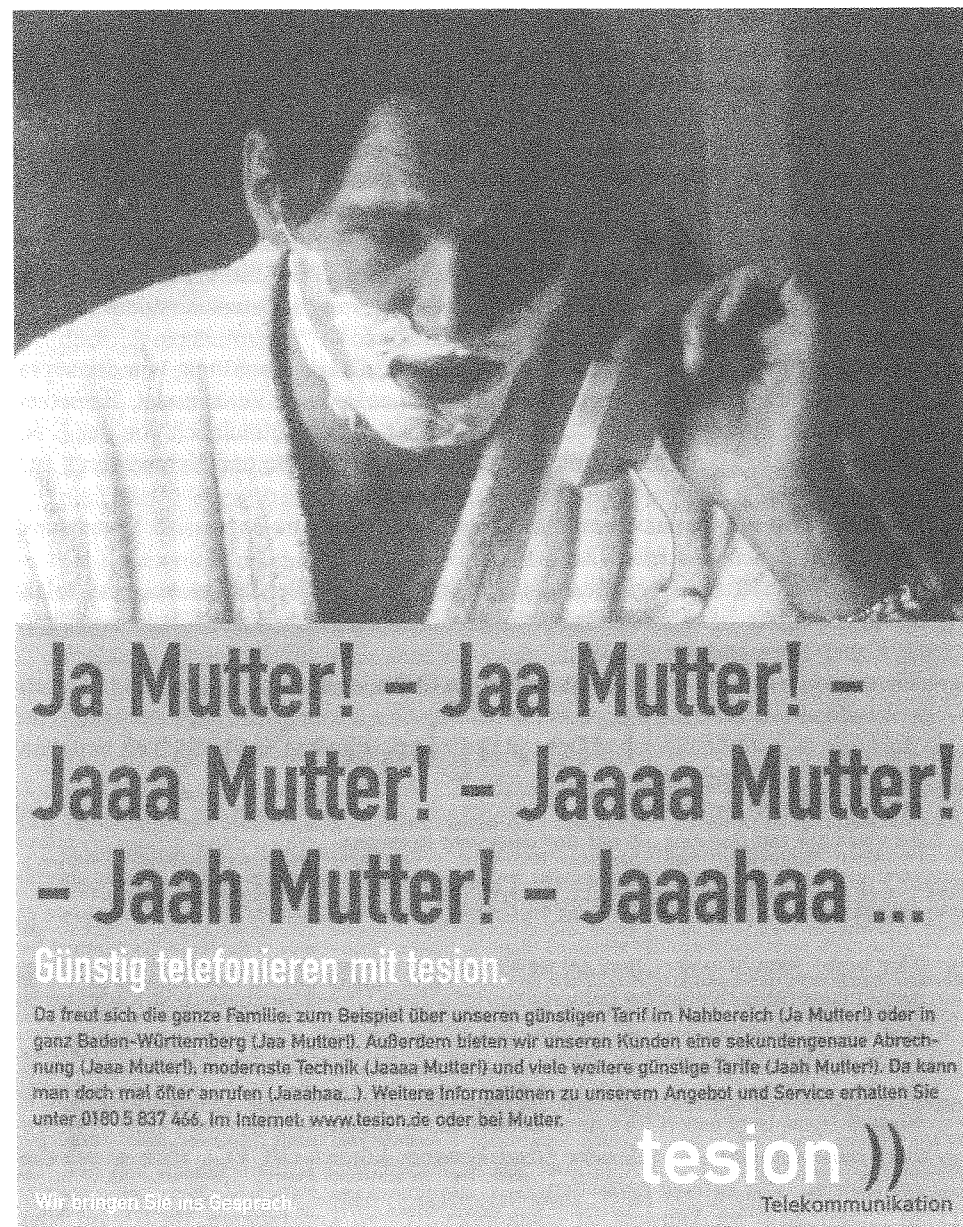
Abb. 1: Stadien der Interjektionalisierung am Beispiel der Werbung von „Tesion“ 11