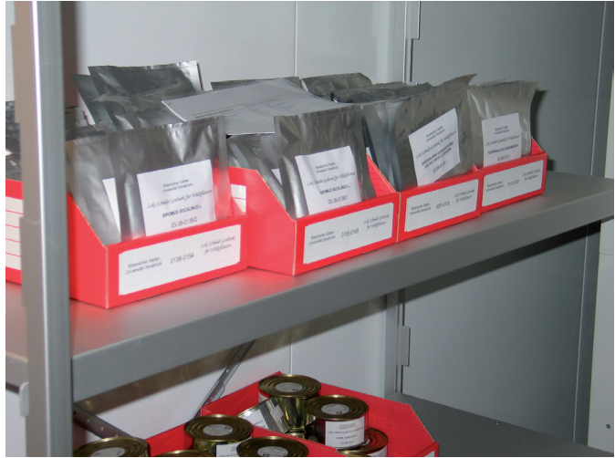
Abb. 2: Saatgutaufbewahrung in vakuumverschweißten Alu-Polyethylen Verbundbeuteln

Seit 2002 wurde damit begonnen, Wildpflanzensaatgut gezielt für die Loki Schmidt-Genbank zu sammeln. Im Jahr 2003 wurde die „Loki Schmidt-Genbank für Wildpflanzen“ als erste offizielle Genbank für Wildpflanzen in Deutschland in Anwesenheit von Frau Prof. Dr. h.c. Hannelore (Loki) Schmidt am Botanischen Garten der Universität Osnabrück eingeweiht.