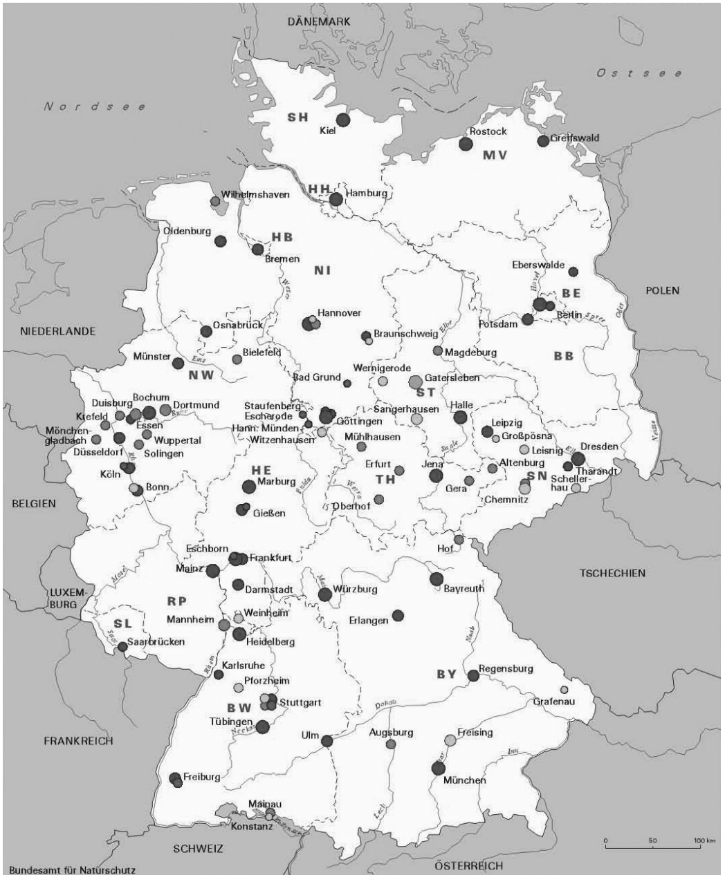
Abb. 6: Überblick über die Botanischen Gärten in Deutschland und vergleichbare Einrichtungen (Klingenstein et al. 2002a)