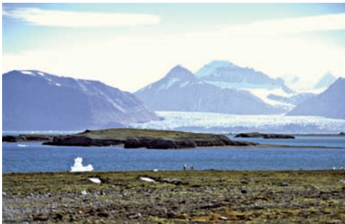
Abb. 2: Untersuchungsgebiet Kongsfjorden (Ny-Ålesund).

Ny-Ålesund ist die nördlichste menschliche Ansiedlung und liegt am Kongsfjorden (Svalbard / Spitzbergen, 78° 55'N, 11° 56'E). Es ist eine ehemalige Bergarbeitersiedlung, die heute ausschließlich für wissenschaftliche Zwecke durch Forschungsinstitute zahlreicher Staaten genutzt werden darf. Dem Dorf vorgelagert liegen mehrere kleine Inseln, die von Nonnengänsen als Koloniestandorte genutzt werden. Mit den Küken schwimmen die Nonnengänsen dann an das Festlandufer. Hier befinden sich mehrere kleine Seen, um die sich grasige und moosreiche Vegetation findet. Abseits der Seen wird das Gelände trockener, felsiger und die Vegetation ändert sich. Saxifragaceen dominieren hier.