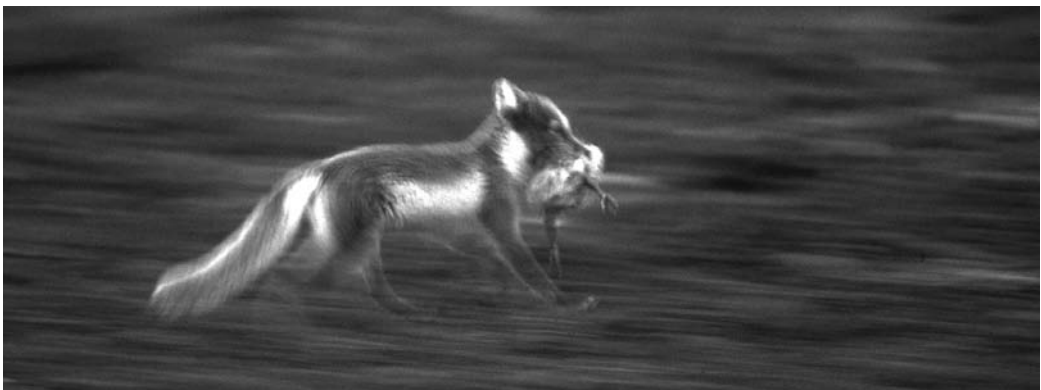
Abb. 6: Eisfuchse sind erfolgreiche Kükenjäger.

Besonders vor dem Hintergrund drohender Gefahr sind Gänse in ihrem Verhalten besonders anpassungsfähig. Verhaltensänderungen stehen immer in Zusammenhang mit konkreten Erfahrungen der Individuen. Diese sind nicht nur von der Prädatorenart abhängig, sondern maßgeblich auch von den Habitatbedingungen des Brutgebietes. So sind die Nonnengänse auf Svalbard allein durch das Fehlen höherer Vegetation aus Weiden oder Birken gezwungen, andere Strategien als ein Verbergen zu entwickeln. Je nach den äußeren Rahmenbedingungen können sie ihre Strategie anpassen und optimieren: während auf Svalbard die Ufernähe guten Schutz bietet, ist es auf Kolguyev entweder der Schutz der großen Gruppe oder der dichten Vegetation. Die Anwesenheit weiterer Fressfeinde mit anderen Jagdstrategien erfordert ebenfalls Anpassungen der Elternvögel. Die Kenntnis verschiedener Feinde und möglicher alternativer Verhaltensweisen ermöglicht die notwendige kurzfristige Verhaltensänderung. Dadurch erklärt sich, dass erfahrene Brutpaare