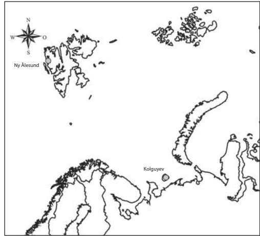
Abb. 1: Lage der Untersuchungsgebiete Ny-Ålesund, Svalbard und Kolguyev, Barentssee

Die Insel Kolguyev liegt abgeschieden und schwer erreichbar an der südöstlichen Schelfzone der Barentssee (69°N / 50°E). Sie ist 75 km in der Nord-Süd- und ca. 60 km in der West-Ost-Ausdehnung groß und liegt 70 km vor der Festlandküste. Die Gesamtgröße beträgt 5200 km 2 (Kruckenberg et al. 2008, Abb. 1). Die Insel ist umgeben von Sandbänken und wattenartigen Lagunen. Auf der Insel selbst können zwei Bereiche unterschieden werden: der nördliche Inselteil ist geprägt durch eine Moränenlandschaft mit Hügeln