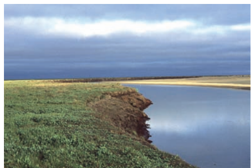
Abb. 3: Untersuchungsgebiet Kolguyev.

Der Permafrost findet sich etwa 75 cm unter der Oberfläche, an einigen Stellen kommt er sogar 38 cm unter der Vegetation vor. Bereits in der zweiten Hälfte des September fällt