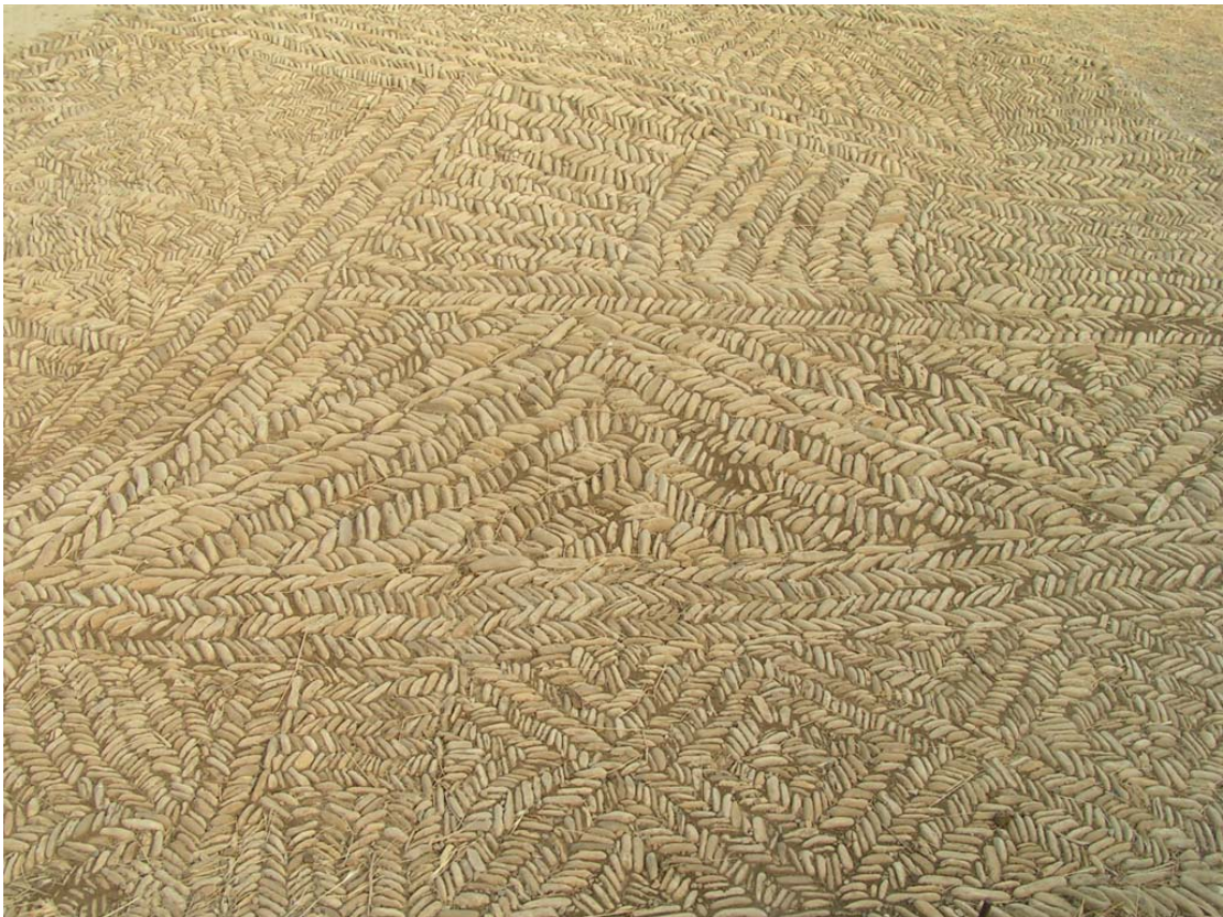
Abb. 3. Selciato, Colle Serpente (Kultgebäude)