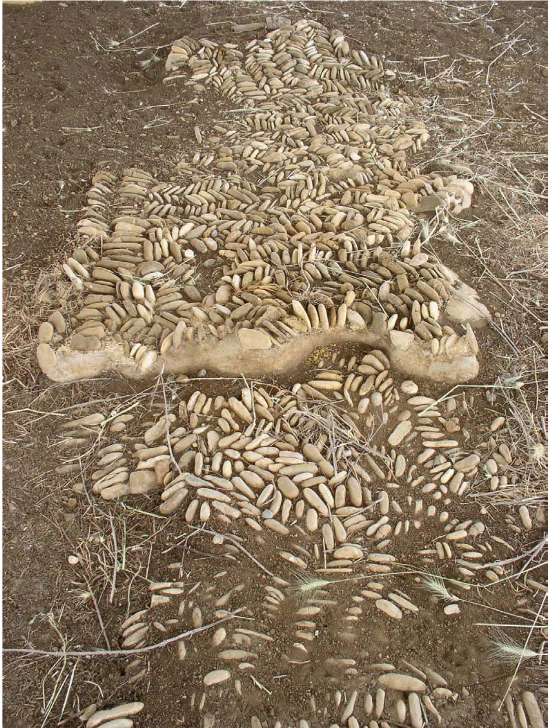
Abb. 1. Selciato, Colle Serpente (1998/99)