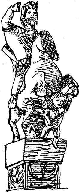
Die Gruppe von Grand. Vgl. Save et Schuler, Le groupe éq. de Grand.

Im Jahre 1898 1) wurde die zu Grand in Lothringen nahe römischen Bädern und einem Amphitheater, merkwürdigerweise auch in einer Zisterne, entdeckte Gruppe von Save und Schuler veröffentlicht. 2) Erhalten ist die obere Hälfte des Denkmals bis etwa zur Mitte der Schuppensäule. Nicht wie sonst auf einer Platte, sondern auf einem mit Amazonenschilden verzierten hohen Blocke (ähnlich wie bei der Mainzer Säule, s. S. 29) steht das Roß mit dem vollbärtigen gepanzerten Reiter, der auf dem Kopf einen Lorbeerkranz und in der Rechten angeblich