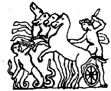
Münze des Antoninus Pius. Cohen 1004.

1. Juppiter, auf dem Viergespann stehend, schleudert den Blitz gegen einen Giganten, der die Keule gegen ihn erhebt: Antoninus Pius (Cohen, Médailles impériales 1004); Septimius Severus (Coh. 250). Bei letzterem ist ein zweiter Gigant schon tot niedergestreckt; die Umschrift lautet: Iovi Victori .