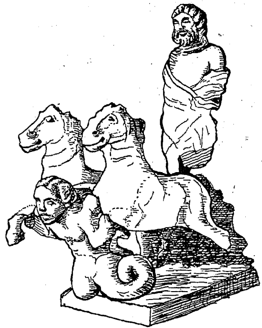
Die Gruppe von Weissenhof. Vgl. Haug und Sixt, Röm. Inschriften Württembergs S. 249.

Recht im Gegensatz hierzu wurde im selben Jahre durch Sixt 6) die Gruppe von Weissenhof bei Besigheim bekannt. Auf diesem hochbedeutenden Fund hat der bartlose Gigant nicht das Roß des Reiters, sondern das Zweigespann eines auf der Biga stehenden bärtigen Wagenlenkers zu stützen. Trotz des weit mehr der Antike ähnlichen Charakters dieser Gruppe schließt sich Sixt dennoch der Hettnerschen Deutung an.