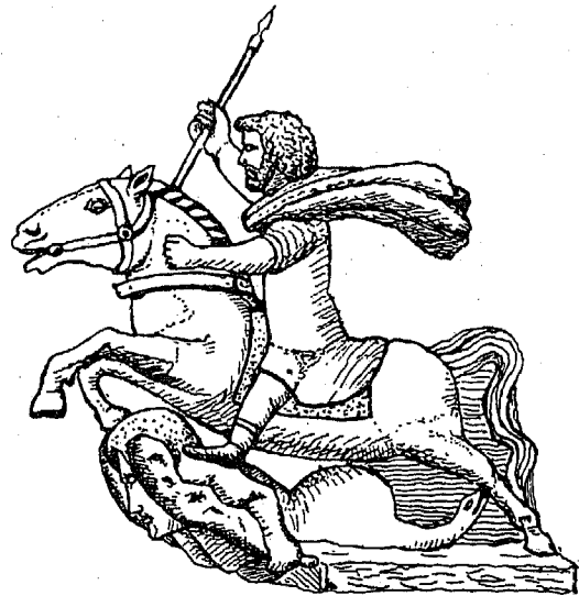
Die Gruppe von Schierstein. Vgl. Nassauische Annalen XXII, Taf. III.

Viele Erscheinungen brachte das Jahr 1890. Zunächst einen bedeutenden neuen Fund, die Gigantensäule von Schierstein aus dem Jahre 221, herausgegeben von B. Florschütz. 9) Sie ist nach der Mertener und Hedderheimer Säule das dritte vollständigere Exemplar, jetzt eine Zierde des Wiesbadener Museums. Auch diese wurde in einem römischen Brunnen in Stücken gefunden. Der Gigant erinnert nach Florschütz an weiblichen Typus; der stolze, siegesbewußte Reiter sei laut der Inschrift »I. O. M.« Jupiter, aber als Reiter aufgefaßt, »wie einen solchen vielleicht die oberste Gottheit der Kelten versinnbildlichte«. Darin Hettner folgend, wendet sich der Verfasser dagegen bei dem Gi-