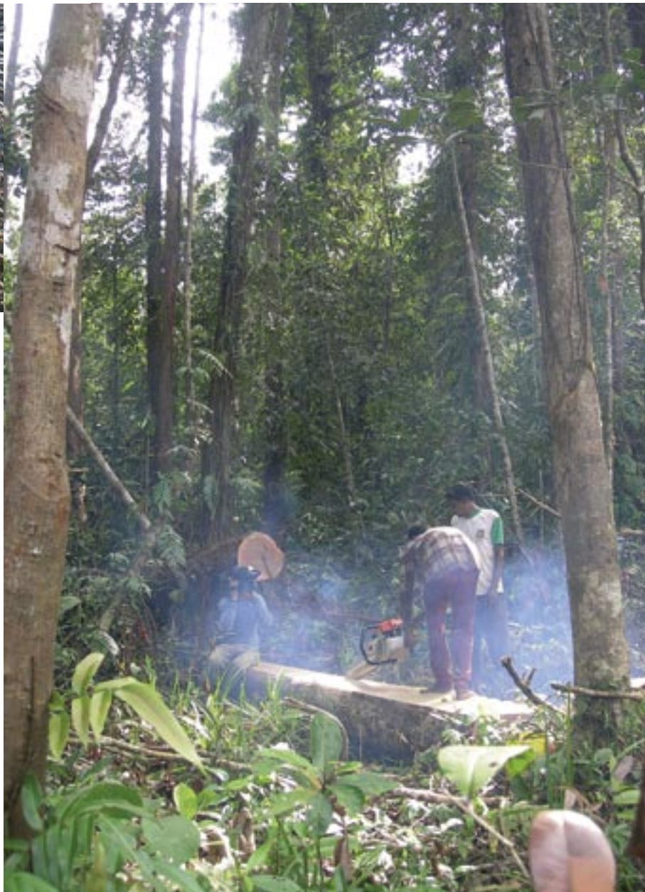
Illegaler Holzeinschlag bei Teneum. Auch die deutsche Botschaft in Jakarta verbreitet die falsche Information, in Aceh würden fünf bis neun Millionen Kubikmeter Holz für den Wiederaufbau benötigt

Von der Weltöffentlichkeit abgeschlossen, hat die Provinz in den letzten Jahren unwiederbringlich Wald verloren. Nach vorsichtigen Daten des indonesischen Forstministeriums von 2002 sind 825.000 von 3,3 Millionen Hektar Wald