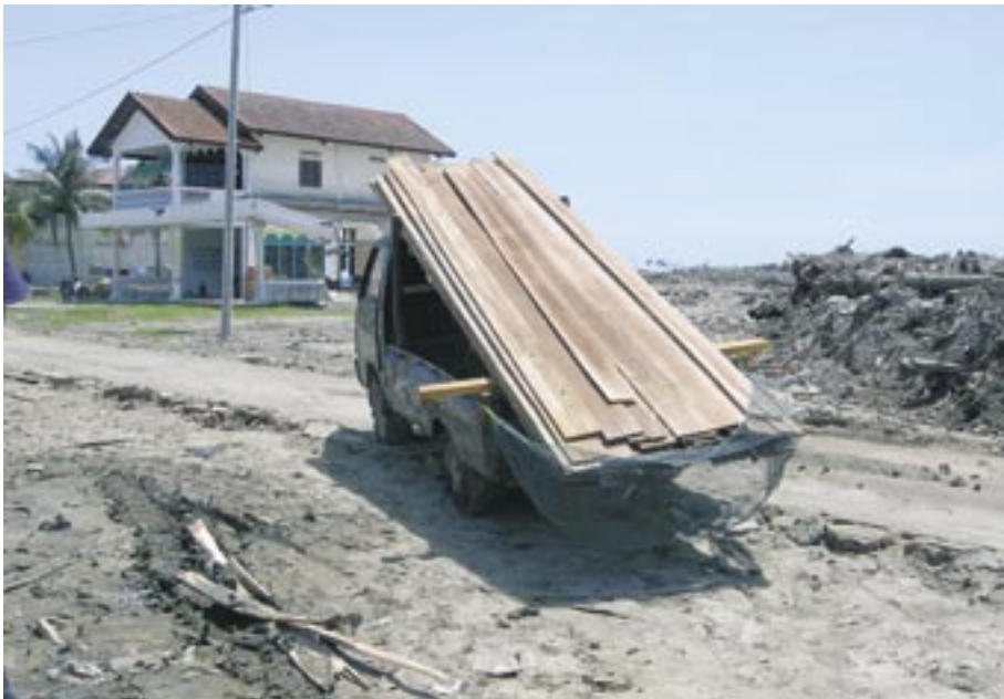
Nach dem Tsunami folgte die größte Hilfswelle seit dem Zweiten Weltkrieg. 8,2 Milliarden Euro versprochen Regierungen weltweit. Doch viele Opfer warten bis heute auf Hilfe für eine neue, langfristige Lebensperspektive

in Aceh degradiert oder nicht mehr vorhanden. Auch in dieser Saison wird nicht nur der deutsche Markt wieder mit Tropenholzmöbeln überschwemmt. Die Hälfte des in die EU importierten Tropenholzes soll zuverlässigen Schätzungen zufolge aus illegalem Holzeinschlag stammen.