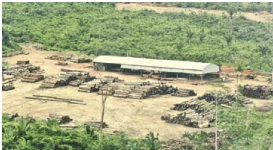
Der Besitzer dieses Sägewerks soll den Mördern von Stang umgerechnet 15.000 Euro versprochen haben