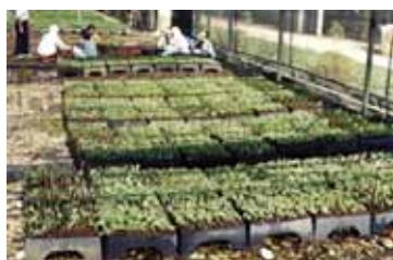
Vermehrung der Eukalyptusbäume durch Stecklinge