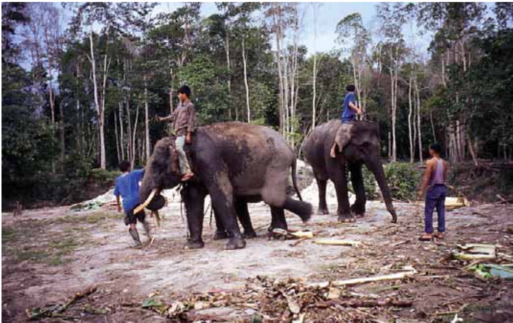
Der Sumatra-Elefant ist durch die Zerstörung seines Lebensraums vom Aussterben bedroht. Einige der letzten Exemplare werden in Trainingscamps gehalten

wald in Plantagen umgewandelt wird. Zwar hat APRIL eine Untersuchung der ökologischen Bedeutung dieses Gebietes bei der Bogor Universität in Auftrag gegeben, doch wurde das Ergebnis nicht der Öffentlichkeit zur Verfügung gestellt.