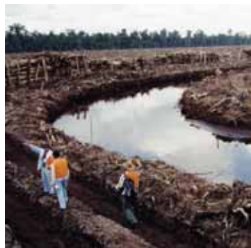
Das Kanalnetz entwässert den ökologisch wertvollen Torfwald

Beide Fabriken beendeten das Geschäft mit einer Reihe von Lieferanten, die nachweislich illegal geschlagenes Holz verkauft hatten und kündigten schärfere Herkunftskontrollen ihres Rohstoffverbrauchs an. „Bei APP war jedoch trotz mehrfacher Nachfrage angeblich niemand verfügbar, der die Kontrolle hätte demonstrieren können. Die einzige erhältliche Information war, dass bisher noch keine EDV bei der Zulieferung eingesetzt wird“, berichtet Jens Wieting. Ein Vertreter von APP habe eingeräumt, dass das Unternehmen derzeit nicht garantieren könne, dass kein Holz aus Schutzgebieten in die Fabrik gelange.