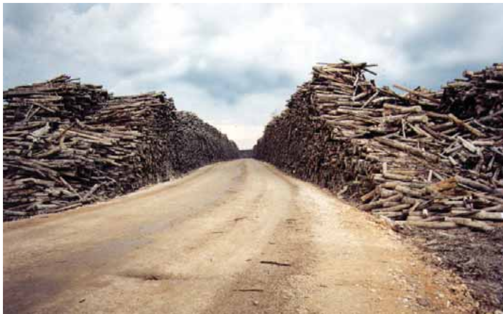
Holz auf dem Fabrikgelände von APRIL.

Die Fläche des Tieflandregenwaldes auf Sumatra schrumpfte zwischen 1990 und 2002 um 60 Prozent. Hauptverantwortlich sind die Zellstoff-, Palmöl- und Holzindustrie sowie die Regierung, die keine Kontrolle ausübt