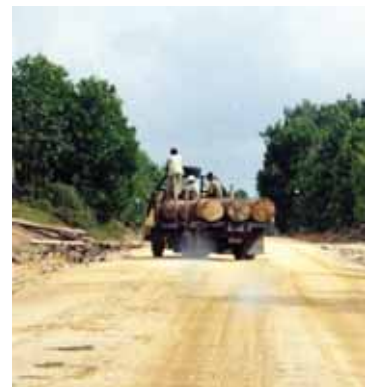
Illegaler Holztransport im Tesso-Nilo-Gebiet auf der von APRIL unterhaltenen Straße

Die Akazienplantagen bieten kaum Lebensraum für Tiere und Pflanzen, und auch diese Flächen werden etwa alle sieben Jahre per Kahlschlag geerntet und unter Einsatz von Düngemitteln und Pestiziden wie „Roundup“ neu bepflanzt.