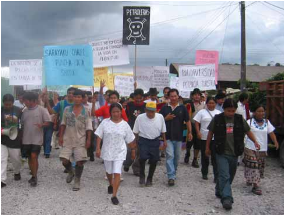
Die Bewohner der Provinz Sarayacu in Ecuador haben mit ihren Protesten das Vordringen des Ölkonzerns CGC auf ihr Land verhindert

ökologisch und sozial vertretbar sind. Die aktuelle Hermesbürgschaft für Maschinellieferungen an APP-China zeigt einmal mehr, dass die rot-grüne Bundesregierung kurzfristige deutsche wirtschaftliche Interessen vor langfristigen Umwelt- und Naturschutz stellt.