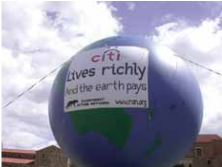
Protestballon gegen die Geschäfte der Citibank