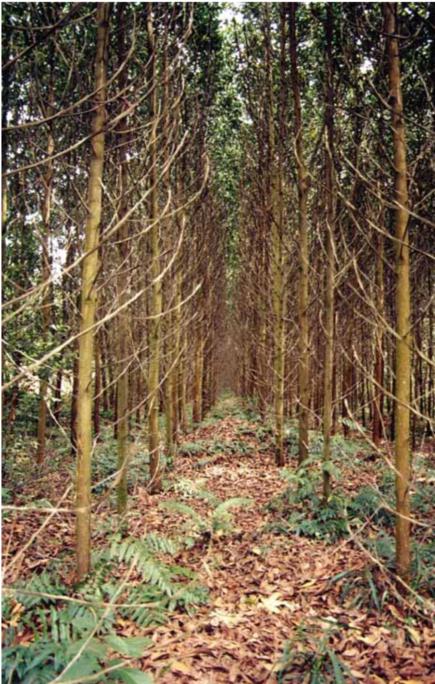
Die Industrialisierung der Waldwirtschaft schafft den multifunktionalen Wald ab