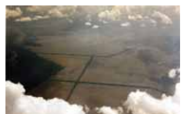
Die APRIL-Konzession Pelalawan aus der Luft