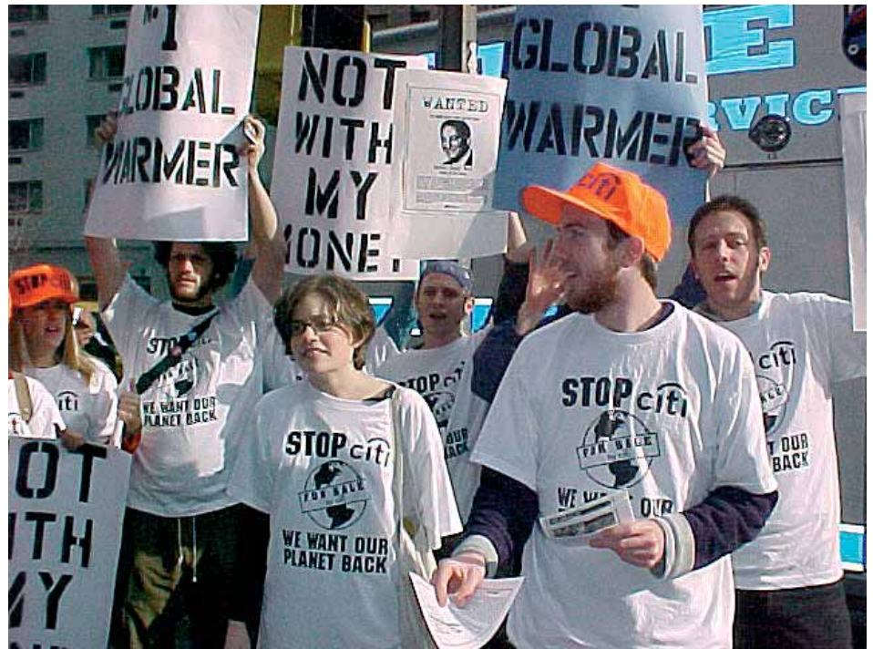
Die Menschen wehren sich gegen weitere Waldvernichtung. Umweltschutzorganisationen aus aller Welt unterstützen ihre Forderungen