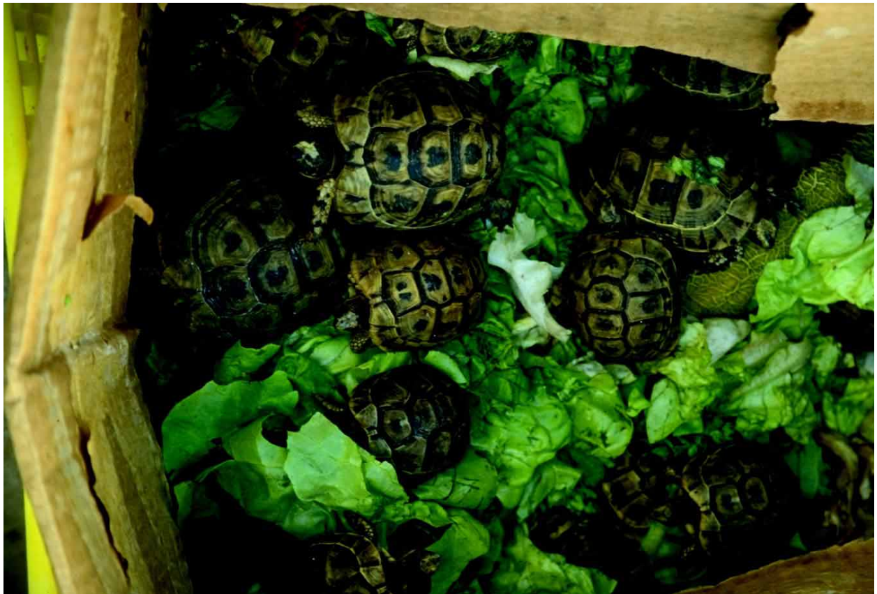
Schildkröten sind nur schwer in Gefangenschaft zu halten. Der Handel muss verboten werden