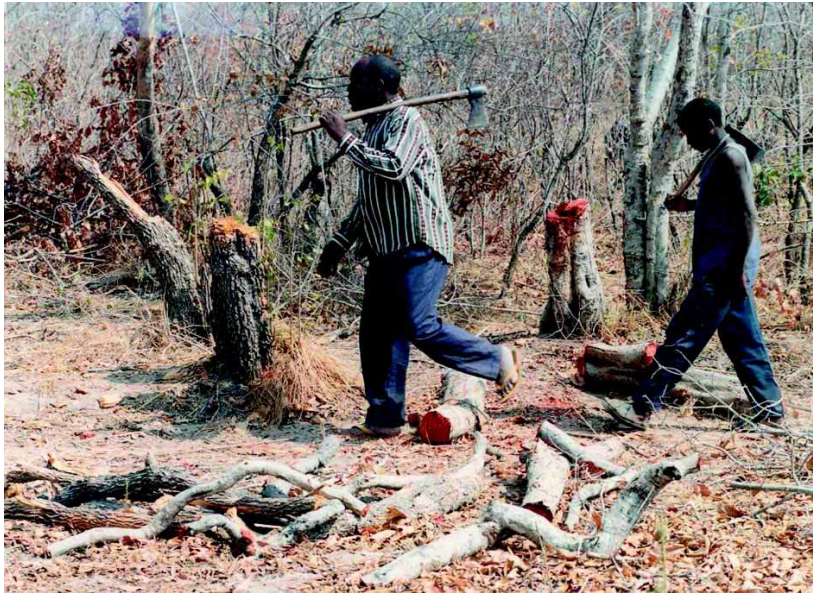
Tabakanbau in den Tropenwäldern gefährdet die Lunge der Erde