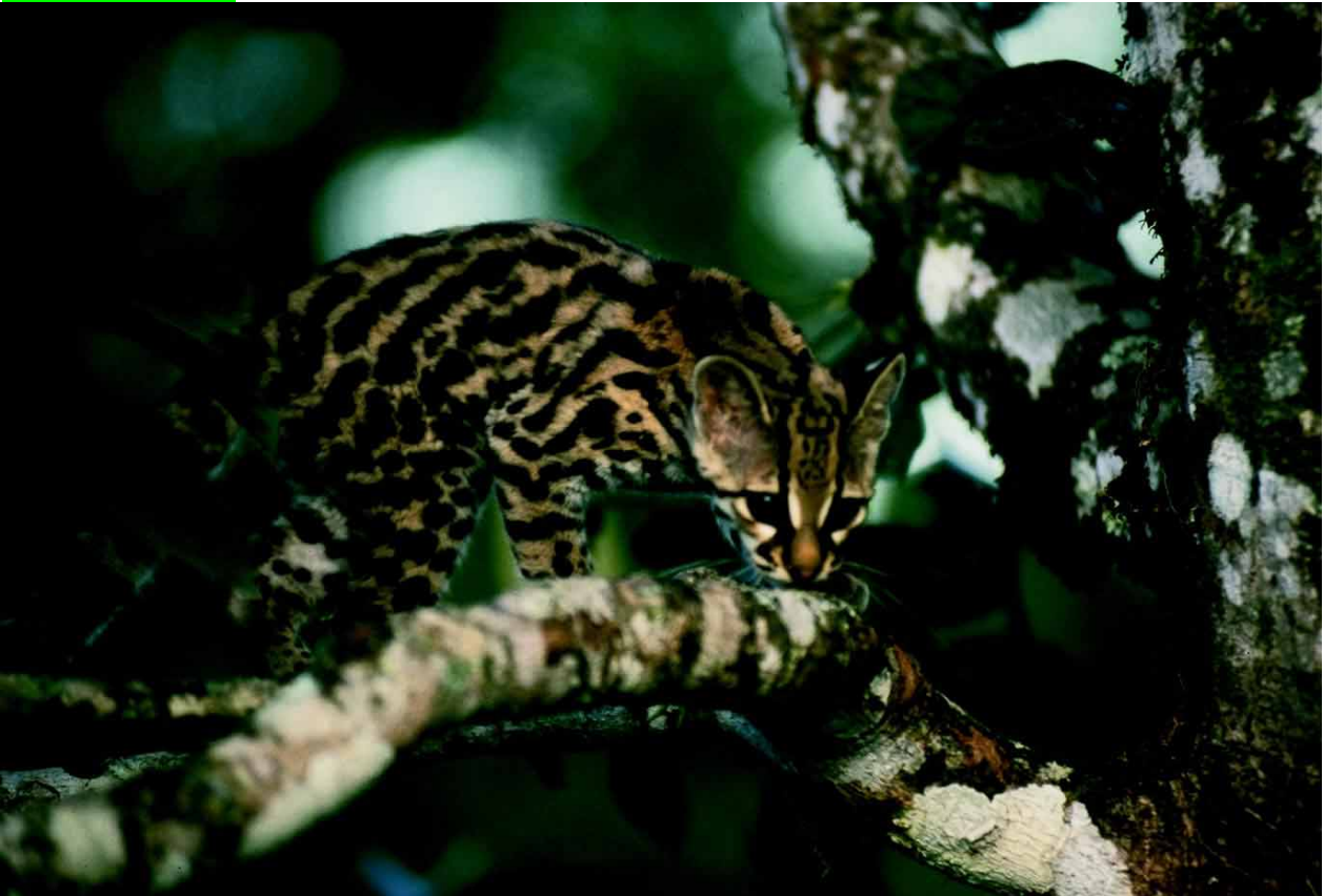
Der Baumozelot aus Mittelamerika wird wegen seines wunderschönen Fells gewildert