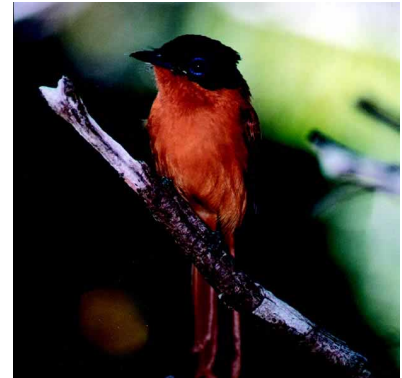
Der deutsche Heimtiermarkt ist gierig: Reptilen, Vögel, Schildkröten und und und. Je seltener, desto teurer und begehrter