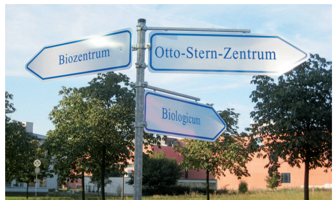
Wegweiser helfen bei der Orientierung auf dem neu gestalteten Campus Riedberg.

Im kommenden Jahr wird eine Kindertagesstätte gebaut. Es gibt einen großen Bedarf an Betreuungsplätzen, derzeit aber nur eine provisorische Kita mit 40 Plätzen. In der neuen Kita an der westlichen Ecke des Campus sollen bis zu 135 Kinder betreut werden. Auch Schüler des Riedberg-Gymnasiums profitieren von der Science City. Das Gymnasium mit natur-