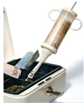
Die Goethe-Universität erhält für Forschungsprojekte eine kräftige Finanzspritze