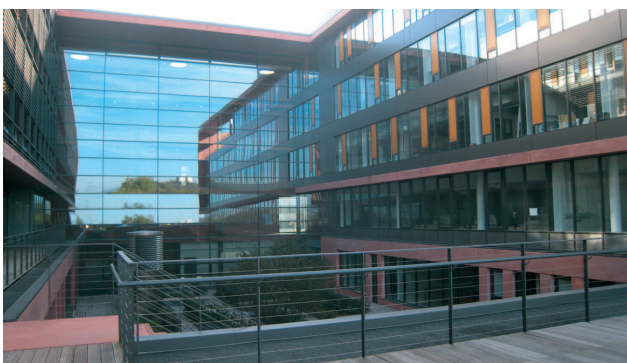
In den vier schön gestalteten Innenhöfen des Biologiums können Studierende ausspannen.

Noch nutzen 12.000 Studenten den alten Campus Bockenheim, davon rund 4.500 Naturwissenschaftler. Der Umzug aller naturwissenschaftlichen Fachbereiche in ihr modernes neues Heim dauert wohl vier Jahre länger als geplant. Doch darüber lässt sich hinwegsehen, denn trotz angespannter Haushaltslage müssen keine Abstriche gemacht werden. Das Land Hessen investiert im Zeitraum 2000 bis 2019 insgesamt 650 Millionen Euro in den Campus Riedberg. „Alles wird so gebaut, wie wir es uns gewünscht haben“, sagt Rost. Wenn 2019 alles fertig ist, haben die Naturwissenschaftler einen hochmodernen Campus. (lw)