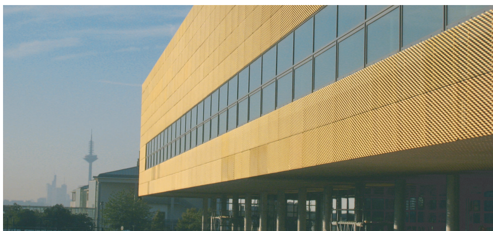
Das Otto-Stern-Zentrum ist nach dem gleichnamigen Physiker und Nobelpreisträger benannt, der 1914 als erster Privatdozent nach Frankfurt kam.

Die drei Baumaßnahmen, entworfen von Gerber Architekten aus Dortmund, haben ein Investitionsvolumen von 150 Millio-