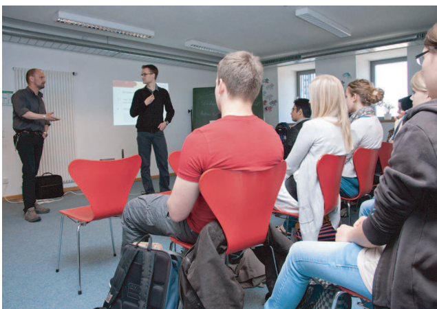
Mentoren von Arbeiterkind.de bei einem Schulbesuch.

Weitere Informationen unter www.arbeiterkind.de