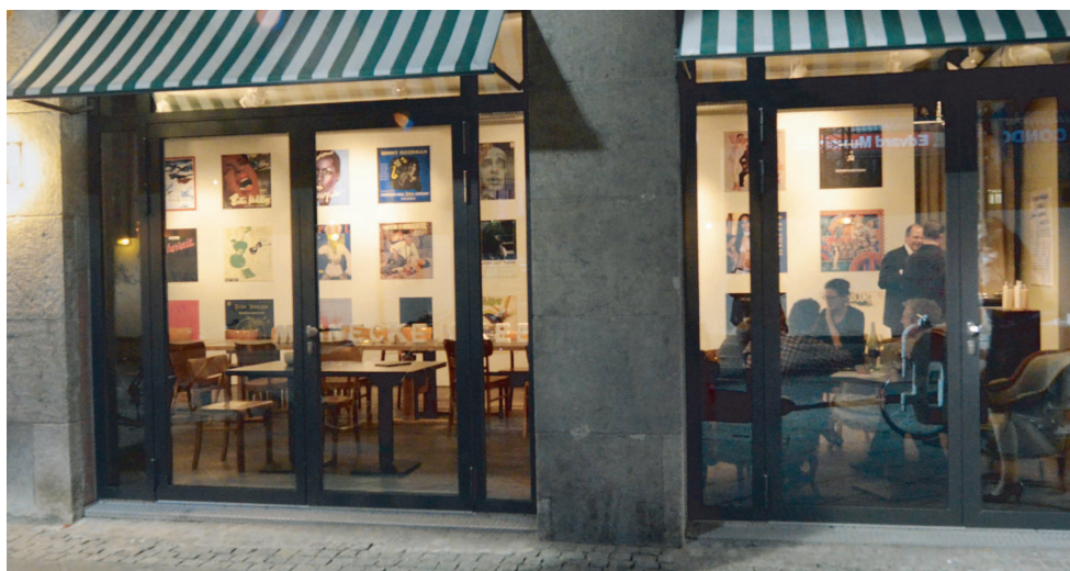
Reinschauen erwünscht: das ‚Haus des Buches‘ in der Braubachstraße 18-22.

Das ‚Fenster zur Stadt‘ ist ein Ausstellungs- und Veranstaltungsraum, der sich vom ‚Margarete‘ hin zum Areal der historischen Altstadt öffnet. Durch große Fenster, die auf die Braubachstraße hinausgehen, kann man nicht nur das Trei-