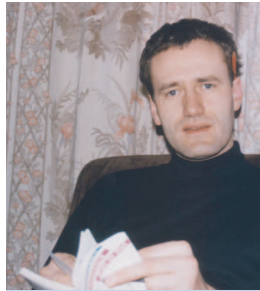
... sowie beim Studium in den 80er Jahren in Frankfurt.

Ich lebte in Offenbach mit meiner Lebenspartnerin, da es damals fast unmöglich war, eine Wohnung für Studenten zu einem auch nur halbwegs akzeptablen Preis in Frankfurt zu bekommen. Positiv daran war, dass ich täglich mit dem Fahrrad zum Uniklinikum fahren konnte.