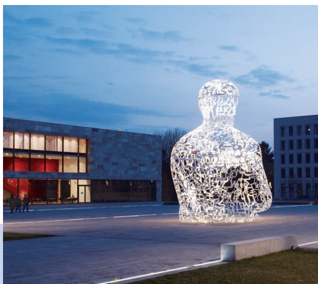
Der Alumni-Ball auf dem Campus Westend ist der sommerliche Höhepunkt der Goethe-Universität!