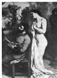
Detalhe PB de L'Atelier du peintre