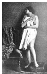
Foto usada como modelo

A programática pintura de Courbet, O Estúdio do Artista (Uma alegoria real de uma fase de sete anos na minha vida artística e moral) , torna claro que se interessava pela realidade nas suas várias manifestações: esta vasta obra, pintada em 1855, retrata o artista a trabalhar numa paisagem da sua terra natal, o Franco-Condado; a seu lado, encontra-se uma jovem nua, um jovem pastor e um gato, enquanto que do lado direito se encontra um grupo de amigos de Courbet, todos eles identificáveis [...]; o lado esquerdo da pintura está ocupado por figuras que simbolizam, entre outras, o trabalho, o comércio e a arte acadêmica.