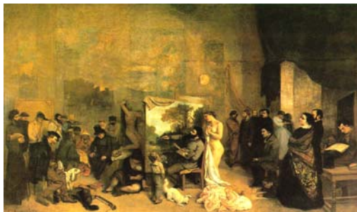
L'Atelier du peintre , Gustave Courbet, 1855

coloca-se entre dois pólos da sociedade da época, ou, um pouco mais poeticamente falando, entre dois mundos: o artístico e o real.