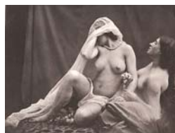
Uma das fotos originais

É fácil perceber que The two ways of life não pretende ser uma imagem que imita a realidade, mas encena uma determinada situação. Neste caso específico de Rejlander, a situação encenada suscitou controvérsias na crítica e no público por seus motivos “questionáveis” como jovens em meio à luxúria de bebidas e prostituição, o que foi visto por alguns como uma referência ou representação da família, da indústria e da religião. Tendo sido exibida na Escócia, por exemplo, apenas o lado direito da imagem pôde ser visto, pois o outro foi ocultado. 16 Pode-se perceber que a cena de Rejlander é dividida ao meio, formando duas partes opostas, dois pólos, dois mundos, dois caminhos de vida . Essa proposta entretando não é nova, em especial nas artes visuais. O pintor renascentista