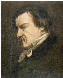
Retrato de Champfleury, Gustave Courbet, 1855

A exposição Le réalisme foi realizada por Courbet num pavilhão próximo à Exposição Universal e, entre outros quadros, foram exibidos os negados pela organização: