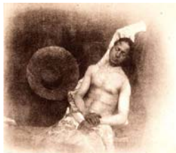
Auto-retrato de Hippolyte Bayard, 1840

Um dos primeiros casos, se não o primeiro, de utilização da fotografia com objetivos propagandísticos pode ser encontrada na conhecida foto de Hippolyte Bayard. Ele foi um dos que também desenvolvia estudos sobre a técnica da fotografia quando do seu “descobrimto.” Aconselhado por Arago, atrasou a apresentação dos seus métodos à Academia Francesa mas, quando o fez, Daguerre já havia registrado seu invento por conselho do mesmo Arago.