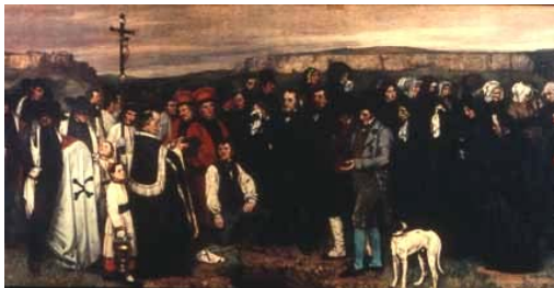
Burial at Ornans , Gustave Courbet, 1849-50

Avaliando as obras expostas por Courbet, a crítica da época não poupou observações negativas que consideravam as pinturas excessivamente fotográficas, como comprova este comentário do crítico Étienne-Jean Deléuze sobre Burial at Ornans : “In that scene, which one might mistake for a faulty daguerreotype, there is the natural coarseness which one always gets in taking nature as it is, and in reproducing it just as it is seen.” 34 Isso demonstra uma reflexão crítica por parte dos comentaristas que consideravam o medium fotográfico como um possível parâmetro comparativo, mesmo que numa comparação negativa, como também consta em uma observação de 1854 sobre certa obra de Holman Hunt, obra essa “tão feia como um daguerreótipo.” 35