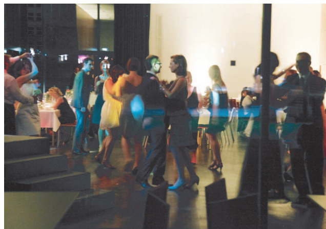
‚Dancing with the Stars‘ – beim Alumni-Sommerball treffen sich Absolventen, Ehemalige, Professoren, Mitarbeiter sowie das Präsidium der Goethe-Universität auf der Tanzfläche.

Samstag, 14. Juli 2012, 19 Uhr Campus Westend, Casino