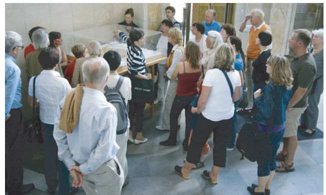
Die Goethe-Universität erlebt derzeit viele Veränderungen, so dass es stets Neues zu entdecken gibt.