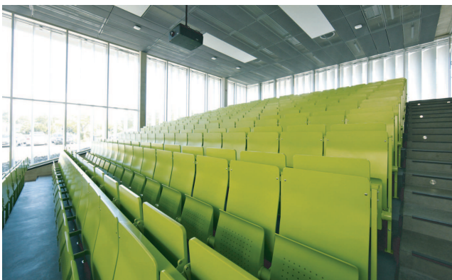
Grün ist die Spielwiese der Sportler – jetzt auch in Hörsaal und Cafeteria.