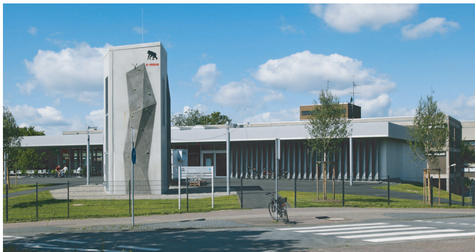
Der Kletterturm ist das neue, weithin sichtbare Wahrzeichen des Sportcampus.