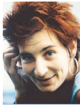
... sowie als Studentin in den 1980er Jahren

Ich wünsche mir für eine Universität der Zukunft, dass neben Fachwissen, e-Learning und was noch kommen mag, der Blick über den eigenen Tellerrand und ein menschliches Miteinander nicht verloren gehen.