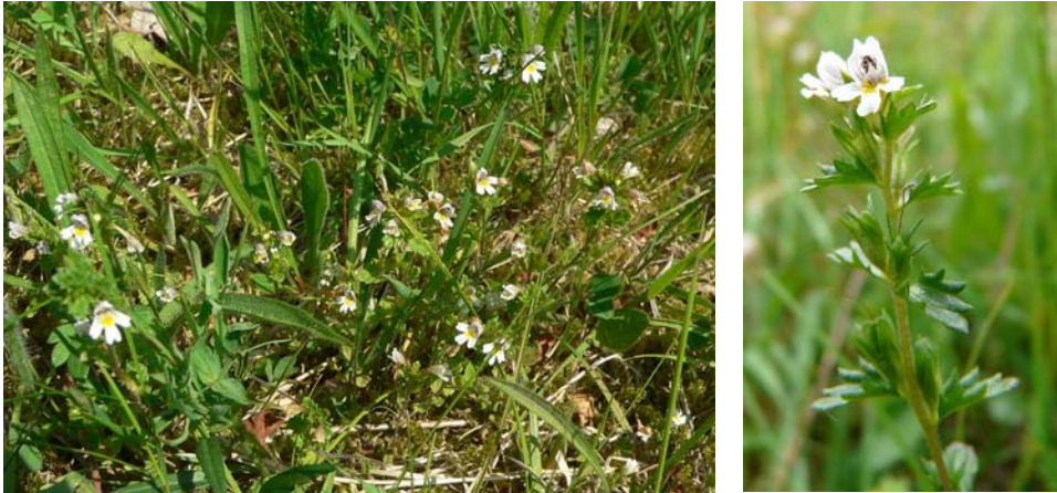
Abbildung 2: Bestand und Habitus von Euphrasia frigida in Wiese am Bellingser Kreuz, 9. Juni 2008.