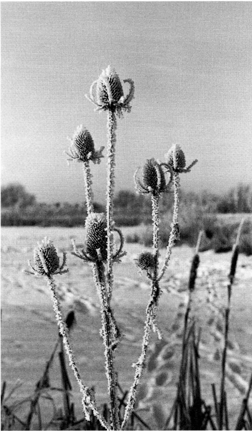
Abb. 2: Dipsacus fullonum L., Bramsche, Regenrückhaltebecken am Vördener Damm, Februar 1996.

Eriophorum vaginatum L., Scheidiges Wollgras. – Thuine, Naturdenkmal Mickelmeer (3410.43) Mü 96.