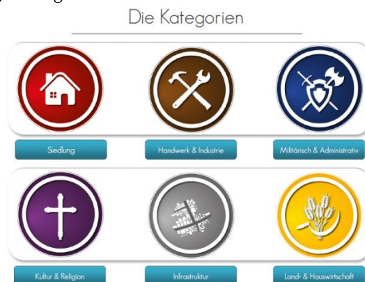
Text und Abbildungen: Arne Büsen

Während und nach Abschluss der Arbeit wurden verschiedene Existenzgründungsveranstaltungen besucht und Kontakte in der Projektregion geknüpft. Expert_innen und regionale Amtsträger_innen bescheinigten dabei gleichermaßen das Potenzial und die Tragfähigkeit des Projektes. Auf dieser Grundlage soll die Gestaltung und Umsetzung der Idee vorangetrieben werden und mittel- bis langfristig eine Existenzgrundlage schaffen.