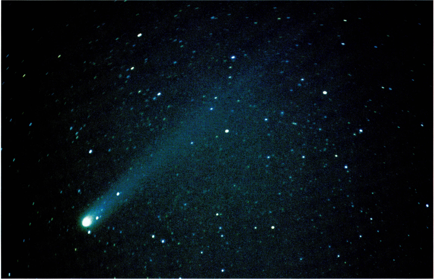
Abb. 2: Komet Hyakutake, am 27. 3. 1996 um 19.35 UT in Südfrankreich mit stehender Kamera fotografiert. Aufnahmeoptik war ein leichtes Teleobjektiv f = 100 \text{ mm}/1:2,8 mit einem 400 ASA Diafilm.