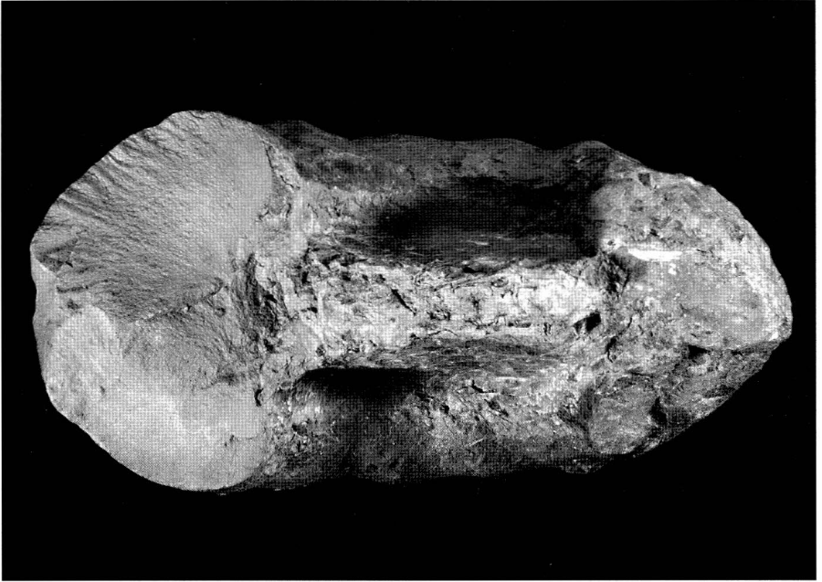
Abb. 3 wie Abb. 1, Querschnitt, nat. Gr.

vergleichbar. – Von außereuropäischen Arten zeigt A. subdoguense VENZO (1959: Taf. 10 Fig. 2) noch am meisten Ähnlichkeit; es unterscheidet sich jedoch in den Gehäusemaßen und im Bau des Nabels.