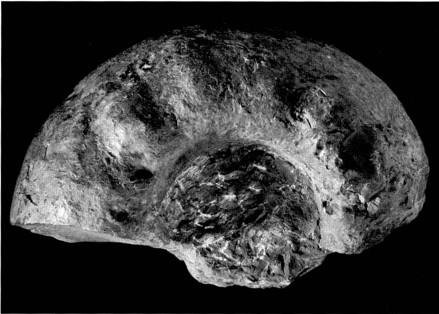
Abb. 1 Aspidoceras aff. orthocera (D'ORBIGNY), Mittleres Kimmeridge, Stollenbank (Mittel-Kimmeridge III) Lateralansicht, nat. Gr.