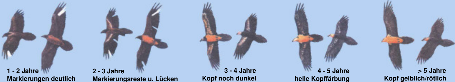
1 - 2 Jahre Markierungen deutlich

Grafiken: El Quebrantahuesos en los Pireneos (R. Heredia y B. Heredia); Ministerio de Agricultura Pesca y Alimentación. Publicaciones del Instituto Nacional para la Conservación de la Naturaleza, 1991