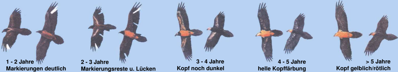
1 - 2 Jahre Markierungen deutlich

Grafiken: El Quebrantahuesos en los Pireneos (R. Heredia y B. Heredia); Ministerio de Agricultura Pesca y Alimentación. Publicaciones del Instituto Nacional para la Conservación de la Naturaleza, 1991