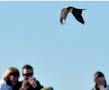
Mancher Bartgeier blieb den Winter über wohl unentdeckt

Der Winter verlief außergewöhnlich ruhig in Österreich. Geht man rein nach der Anzahl der Meldungen, blieben viele Regionen über Wochen regelrecht "bartgeierleer". Auch fix etablierte Altvögel schienen völlig von der Bildfläche ver-