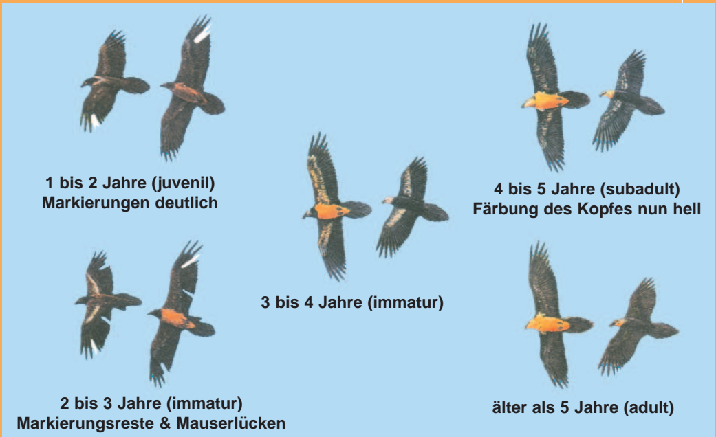
1 bis 2 Jahre (juvenil) Markierungen deutlich