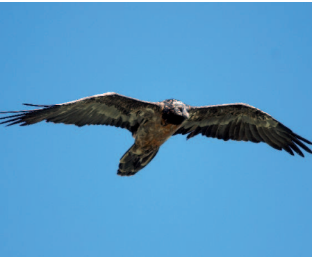
Hubertus 2 scheint das Männchen im Paar östlich der Ankogelgruppe zu sein

In Kärnten wurden in den letzten Wochen zumindest sechs verschiedene Bartgeier nachgewiesen. Regelmäßig konnte das Paar in der östlichen Ankogelgruppe gesichtet werden. Ein ausgewerteter Federfund bestätigte Hubertus 2 (Kals 2004) als männliches Tier, was wahrscheinlich gleichzeitig auch erklärt, warum das junge Paar nicht zur Brut