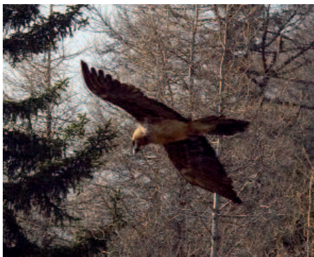
Seit längerem wird in Osttirol nur das Männchen des letztjährigen Paares bestätigt

diese Zeit auch mehrere Sichtungen eines vier- bis fünfjährigen Vogels aus dem Raum Prägraten vor. Seit Jahresbeginn scheint der Osttiroler Altvogel immer weitere Kreise zu ziehen und konnte nur mehr unregelmäßig bestätigt werden. Im Jänner wurde noch einmal Rurese (Rauris 2008) in Kals beobachtet. Von Interesse war die wiederholte Sichtung von zwei