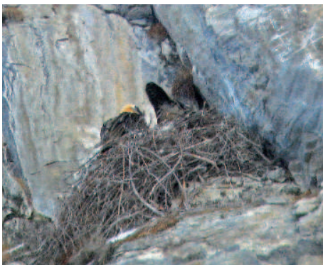
Auch 2009 wurde leider nichts aus der erhofften Bartgeierbrut in Österreich

Um welche beiden Tiere es sich dabei in der Hauptbrutsaison gehandelt haben könnte, ist völlig unklar. Anfang März wurde noch ein Bartgeier im deutschen Teil des Hagengebirges von einem Tourengeher gesichtet. Das markierte und besenderte Männchen Blick (CH 2007) hielt sich im März über mehrere Wochen immer wieder im Allgäu auf, danach wurde es ruhiger.