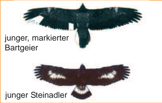
junger, markierter Bartgeier