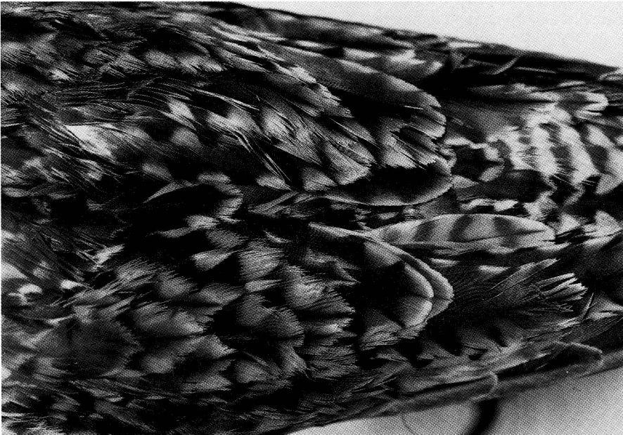
Abb. 2 Schirm- und Armschwingen des Eskimo-Brachvogels, „Weibchen“, ausgefranster Rand: alte Federn, glatter Rand: neue Federn.

Die beiden Eskimo-Brachvögel im Museum am Schölerberg – Natur und Umwelt in Osnabrück sind in „natürlicher“ Position präpariert (Abb. 1); die Flügel sind an den Körper geklebt. Entsprechend den Alterskriterien nach PRATER et al. (1977) und HAYMAN et al. (1986) sowie der Ansicht von J. MARCHANT (Schriftliche Mitteilung) handelt es sich bei beiden Exemplaren um adulte Vögel. Wahrscheinlich sind es ein Männchen und ein Weibchen, wie aufgrund der unterschiedlichen Größe angenommen werden kann. Beim „Weibchen“ sind die Schirm- und Schulterfedern mit den Adult-Merkmalen nur ein wenig abgetragen; zwischen ihnen befinden sich aber deutlich sichtbar frisch gemauserte Federn mit glattem Rand (Abb. 2). Die Mantelfedern und die Flügeldecken sind stark abgetragen; die Handschwingen dagegen in relativ frischem Zustand. Auch beim „Männchen“ ist dieselbe Abnutzung am Gefieder zu erkennen. Daher kann angenommen werden, daß die beiden Eskimo-Brachvögel höchst wahrscheinlich im Frühjahr erlegt worden sind. Es kann aber nicht ausge-