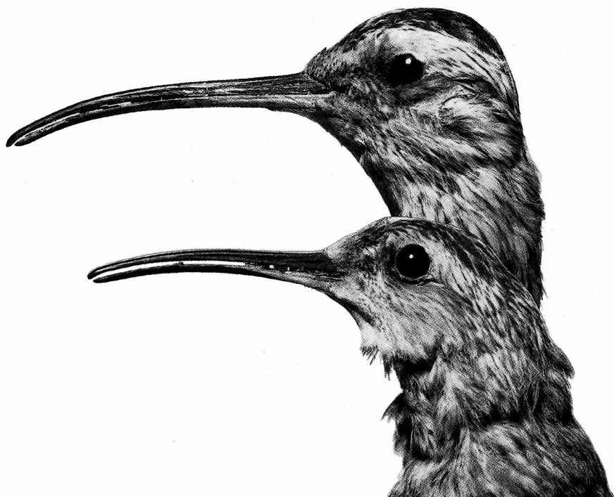
Abb. 4 Schnabelformen beim Eskimo-Brachvogel oben „Weibchen“ unten „Männchen“