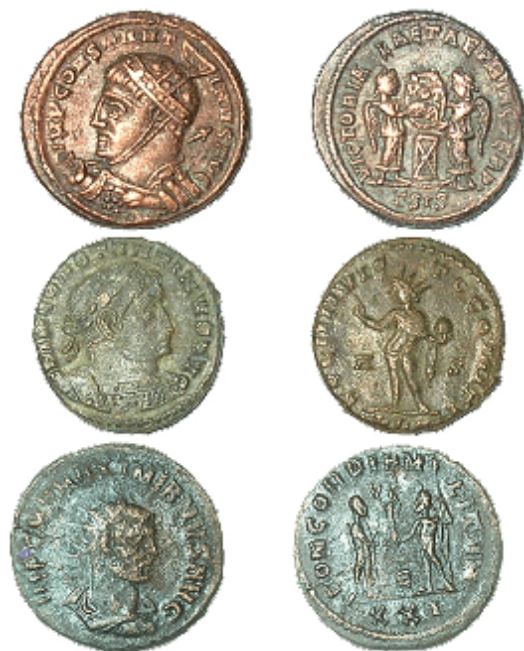
Figure 3. A selection of excavated coin finds from Yotvata, Israel. A.) foliis of Constantine the Great, RIC VII (Siscia) 55; B.) foliis of Constantine the Great, RIC VII (Lugdunum) 53; C.) foliis of Maximian, RIC V.2 (Max. Herc.) 607.

Those who argue that proper archaeological sites do not produce large numbers of coins are simply unfamiliar with the scholarly literature. Many large hoards and thousands of single finds can be found at sites of varying sizes. Familiarization with the Fundmünzen inventories and similar publications will show that coin finds frequently are found in great numbers at civilian and military sites alike, as the numbers from Burghöfe illustrate. The idea that large hoards, devoid of any archaeological context associated with settlement-remains, satisfy collector and dealer demand is a fallacy; in fact, the selling practices of many coin dealers betray this notion. For example, when looking at bulk lots of coins on eBay and VCoins, one can read in the descriptions various disclaimers that there may be a mixture of Greek, Roman, Islamic, Medieval, or even modern coins in the lots; clearly, these are not the contents of an ancient hoard, which usually would have a much tighter chronological association, but rather the accumulation of coins robbed from multiple archaeological sites with different periods and ranges of occupation.