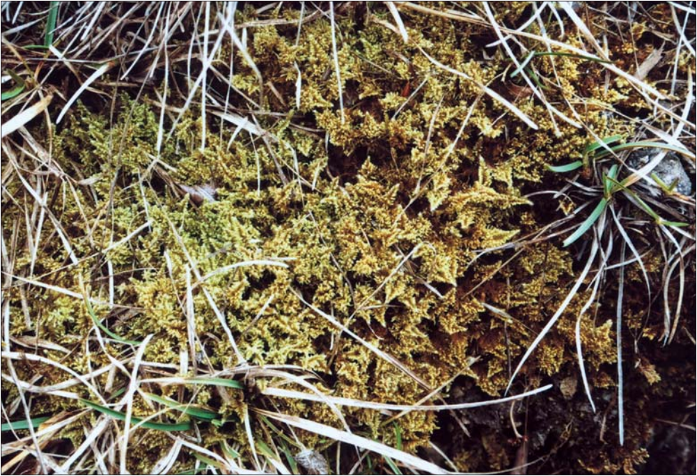
Abb. 6: Ctenidium molluscum kennzeichnet das Ctenidietum mollusci und gehört zu den typischen Moosen der Bodenschicht des Teucrio-Seslerietum . Schumannsberg bei Köllme.