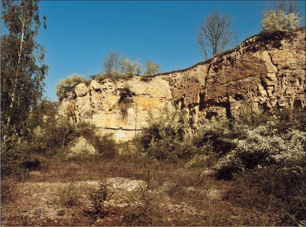
Abb. 3: Steinbruch auf dem Kirchberg bei Köllme. Auf der Sohle wächst verbreitet das Tortelletum inclinatae . An der Bruchwand hat sich auf eingespültem Löss das Aloinetum rigidae mit Tortula brevissima und Pterygoneurum lamellatum eingestellt.

der Kryptogamen wird KOPERSKI et al. (2000) und SCHOLZ (2000), der Gefäßpflanzen JÄGER & WERNER (2002), der Syntaxa bezüglich der Moosgesellschaften MARSTALLER (2006a), der Flechtengesellschaften DREHWALD (1993) und der Pflanzengesellschaften RENNWALD (2000) gefolgt. Die Größe der Aufnahmeflächen richtet sich nach deren Homogenität und beträgt 1–2 dm 2 (Tab. 3–9, 11) bzw. 3–4 dm 2 (Tab. 1–2, 10, 12–14). Kryptogamen, die sehr kümmerlich oder in juvenilen Formen wachsen, sind durch ° (z. B. +°) gekennzeichnet. In den Tabellen bedeuten die Ziffern in der Zeile Fundorte: MTB-Quadrant 4536/2, 1: Gebiet des Schauchensbergs, 2: Gebiet des Kirchbergs. MTB-Quadrant 4436/4, 3: Gebiet des Schumannsbergs, 4: Gebiet des Nikolausbergs. MTB-Quadrant 4437/3, 5: Ostabschnitt des NSG nordwestlich Lieskau.