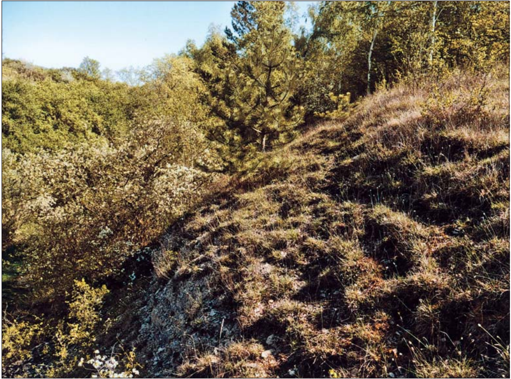
Abb. 4: Bestand des Teucro-Seslerietum am Nordhang des Schumannsbergs. Unter den Moosen wachsen verbreitet Ctenidium molluscum , Campyllum chrysophyllum , vereinzelt Tortella tortuosa und Fissidens dubius .

Campyllum chrysophyllum und Hypnum cupressiforme var. lacunosum durchsetzen, lokal konnten Rhynchostegium megapolitanum und Weissia brachycarpa beobachtet werden. Im Bereich exponierter Lössstandorte trifft man das Festuco valesiacae-Stipetum capillatae Silinger 1931 an. In den lückenhaften Beständen wachsen verstärkt konkurrenzschwächere akrokarpe Laubmoose, unter denen Pterygoneurum ovatum , Pottia lanceolata , Didymodon fallax , Weissia longifolia , lokal Tortella inclinata auffallen.