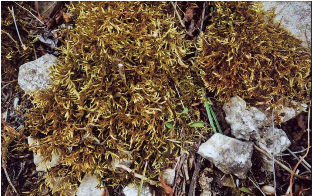
Abb. 9: Zu den häufigsten und auffallenden Moosen gehört Homalothecium lutescens . Es bedeckt insbesondere in Steinbrüchen und unter lichten Gebüsch skelettreiche Böden mit umfangreichen Vorkommen. Schumannsberg bei Köllme.