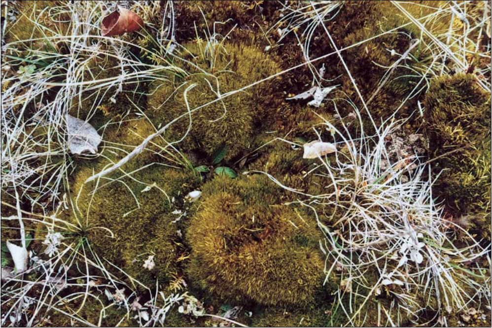
Abb. 8: Ditrichum flexicaule hat sich in Steinbrüchen stark ausgebreitet. Es kennzeichnet die Bodenschicht der Halbtrockenrasen und verschiedene Moosgesellschaften, insbesondere das Tortelletum inclinatae und Assoziationen des Ctenidium mollusci . Steinbruch auf dem Kirchenberg.