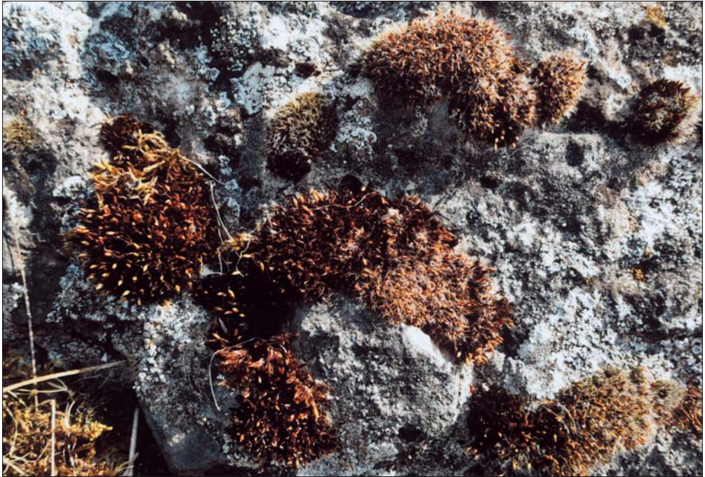
Abb. 7: Polstermoose, wie Orthotrichum anomalum und Grimmia pulvinata , kennzeichnen das Orthotricho-anomali-Grimmiatum pulvinatae. Steinbruch auf dem Kirchenberg bei Köllme.

In der Regel sind ähnlich zusammengesetzte Moosbestände mit Gefäßpflanzen durchsetzt und als Mooschicht von Gefäßpflanzengesellschaften anzusehen.