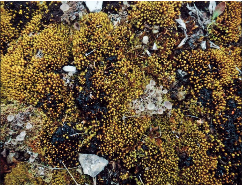
Abb. 5: Der Steinbruch auf dem Kirchenberg zeichnet sich durch umfangreiche Vorkommen des Tortelletum inclinatae mit dominierender Tortella inclinata und vereinzelt Cladonia pyxidata aus.

Auf trockenen, feinerdereichen Mullblößen innerhalb der Halbtrockenrasen gedeiht insbesondere am Schaugenberg, Kirchenberg, Schumannsberg und spärlicher bei Lieskau das Astometum crispi (Tab. 4). Zu Weissia longifolia gesellen sich oft Phascum curvicolle , Pottia lanceolata , Barbula unguiculata , stellenweise Acaulon triquetrum , Pottia mutica , Bryum radiculosum und B. bicolor . Bemerkenswert ist außerdem das Vorkommen des um Halle seltenen, sehr unscheinbaren Kleinmooses Phascum floerkeanum am Südhang des Schaugenbergs. Das Astometum crispi typicum kommt in der verbreiteten Typischen Variante und nur an der Oberhangkante des Schaugenbergs auf weniger basischem Löss in der Pottia