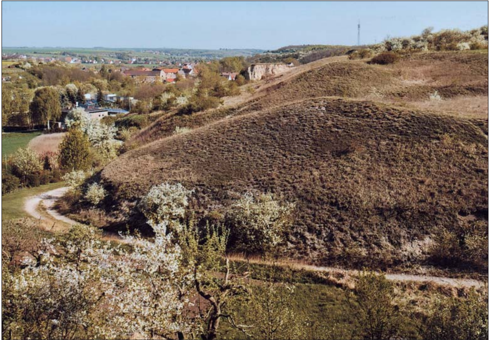
Abb. 2: Der durch kurze Täler gegliederte Westhang des Kirchenbergs bei Köllme zeichnet sich durch kontinentale Halbtrockenrasen aus, in die zahlreiche thermophile Moosgesellschaften eingebettet sind.

lichen Nutzflächen beherrschten Hochfläche. Das Teilgebiet des NSG bei Lieskau ist durch ein bis 20 m tief eingeschnittenes Tal ausgezeichnet.