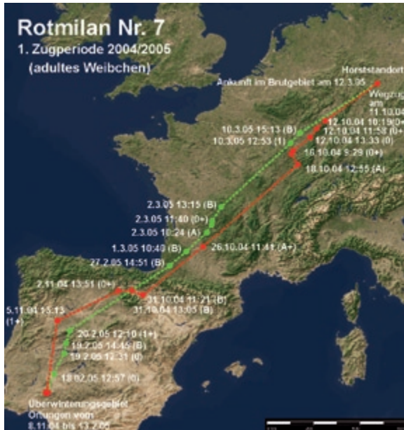
Abb. 6: Weg- und Heimzug des Rotmilans 7 in der Zugperiode 2004/2005. – Autumn and spring migration of the Red Kite 7 in the migration periods 2004/2005.