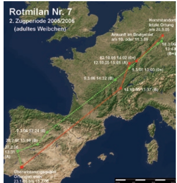
Abb. 7: Weg- und Heimzug des Rotmilans 7 in der Zugperiode 2005/2006. – Autumn and spring migration of the Red Kite 7 in the migration periods 2005/2006.

triert werden konnte. Dafür benötigte er etwa vier Wochen (27-29 Tage). Pro Tag flog der Rotmilan also im Durchschnitt reichlich 80 km.