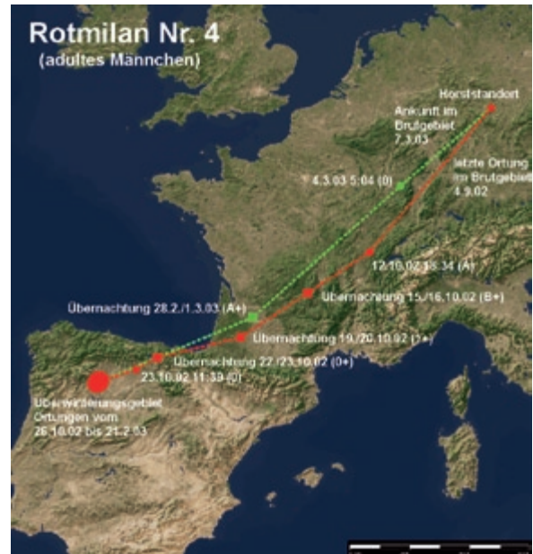
Abb. 4: Weg- und Heimzug des Rotmilans 4. – Autumn and spring migration of the Red Kite 4.

Dieser Rotmilan konnte im Laufe des Winters an vier verschiedenen Schlafplätzen (Tab. 8 C bis F) geortet werden, zwischen denen er teilweise auch mehrfach wechselte. Am 20. Dezember 2002 suchten wir zwei dieser Schlafplätze auf, die 19 km voneinander entfernt lagen. Da recht genaue Ortungen (LC 3) vorlagen, ließen sie sich gut finden. Am Schlafplatz C übernachteten