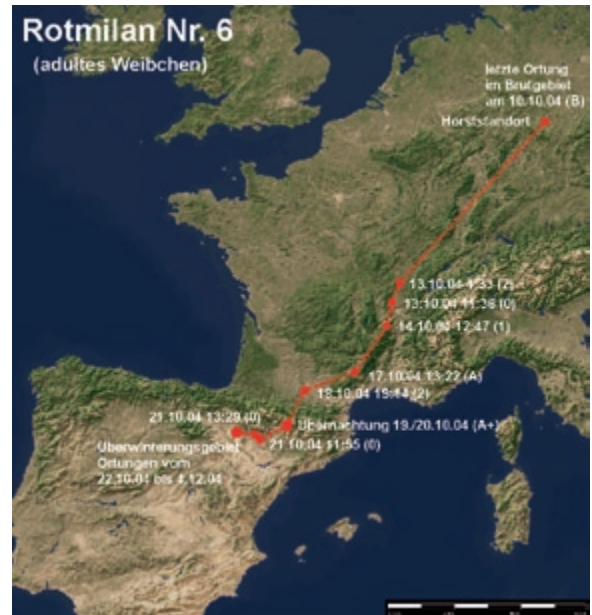
Abb. 5: Wegzug des Rotmilans 6 im Herbst 2004. – Autumn migration of the Red Kite 6 in 2004.

Im Jahr 2004 wurden drei weitere Rotmilane mit PTTs markiert. Das Weibchen Nr. 6 konnte im Sommer 2006 erneut gefangen werden. Es hatte in beiden Jahren nach der Besenderung erfolgreich gebrütet. Da der Sender nur im ersten Jahr auswertbare Daten vom Wegzug nach Spanien geliefert hatte und später nur noch Ortungen in den Sommermonaten stattfanden, wurde er entfernt. Dabei erfolgte eine Untersuchung des Vogels, um festzustellen, ob durch den PTT und seine Befestigung Schäden entstanden waren. Insbesondere wurden das Gefieder und die Hautpartien, an denen die Teflon-