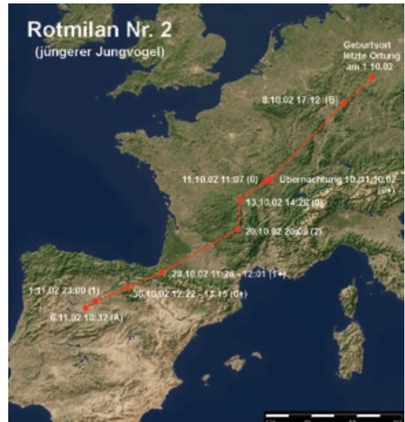
Abb. 3: Wegzug des Rotmilans 2. – Autumn migration of the Red Kite 2.

Angaben zur Zugdauer und der mindestens zurückgelegten Strecke sind Tab. 6 zu entnehmen. Das Winterquartier ist eine von Bergketten begrenzte 600-700 m hoch gelegene Ebene, die landwirtschaftlich meist extensiv genutzt wird. Aussagen über die Ausdehnung dieses Gebietes sind nur eingeschränkt möglich, da von 50 Ortungen in diesem Bereich nur zwei die LC 1 und besser aufwiesen. So lag eine sehr genaue Ortung (LC 3) vom 24. November (N 42° 40' 52", W 3° 29' 31") nur 6,5 ± 3,5 km entfernt von einer Position am 14. Januar (N 42° 39' 32", W 3° 25' 8") der LC 1.