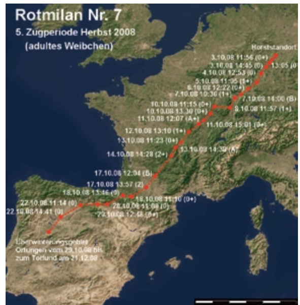
Abb. 9: Wegzug des Rotmilans 7 im Herbst 2008. – Autumn migration of the Red Kite 7 in 2008.