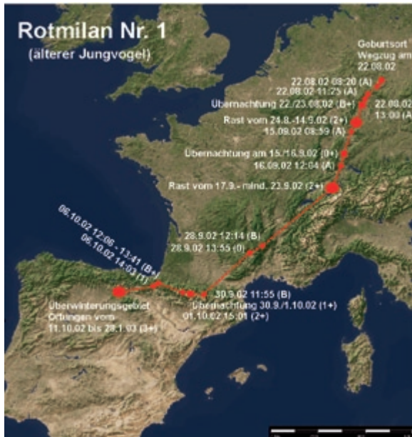
Abb. 2: Wegzug des Rotmilans 1. – Autumn migration of the Red Kite 1.