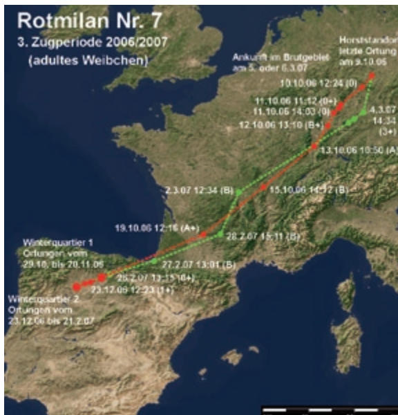
Abb. 8: Weg- und Heimzug des Rotmilans 7 in der Zugperiode 2006/2007. – Autumn and spring migration of the Red Kite 7 in the migration periods 2006/2007.

2 - Die in Klammern angegebenen Werte sind Abschätzungen der tatsächlichen Wegzug-, Ankunftsstermine oder der Zugdauer, die durch Hochrechnung aus den vorhergehenden oder nachfolgenden Streckenabschnitten und Ortungen entstanden sind. – The figures in brackets are estimates of the actual values. The figures in brackets are estimates of the actual departure on migration, arrival or duration of migration. The values are derived from an extrapolation of the previous or subsequent migration flight distances and fixes taken.