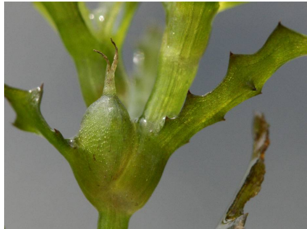
Abb. 8: Najas marina subsp. intermedia, unreife Frucht an einer weiblichen Pflanze in Nahaufnahme (Duisburg-Homberg, 04.08.2012,).