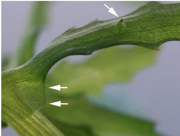
Abb. 7: Najas marina subsp. intermedia, Blatt mit Stachel auf der Mittelrippe der Blattunterseite (oberer Pfeil) und zwei Zähnen an der Blattscheide (untere Pfeile) (Duisburg-Homberg, 04.08.2012,).