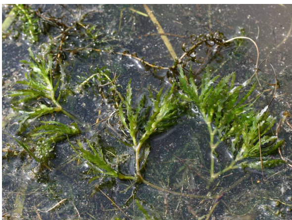
Abb. 1: Najas marina subsp. intermedia, am Ufer eines Abgrabungsgewässers am Niederrhein in Duisburg-Homburg (04.08.2012,).