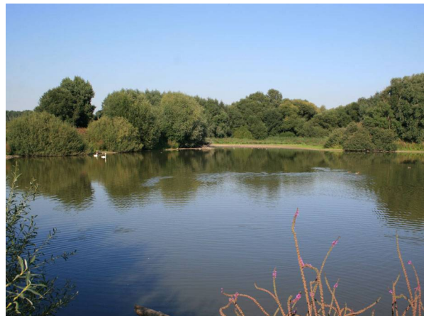
Abb. 3: Fundort von Najas marina subsp. intermedia im NSG "Werthausener Wardt" in Duisburg-Rheinhausen, Blick nach Nordwesten (08.09.2012,).