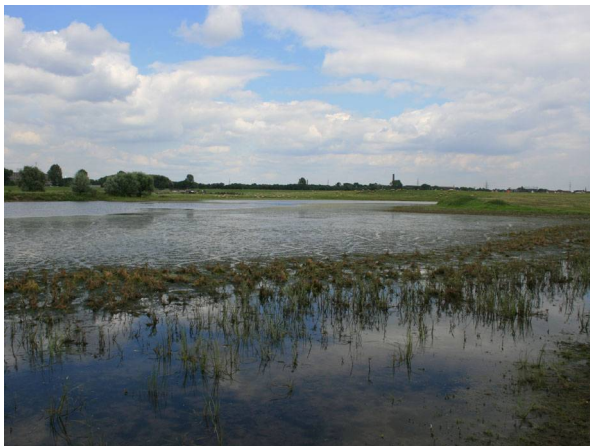
Abb. 3: Fundort von Najas marina subsp. intermedia, Abgrabungsgewässer in Duisburg-Homberg, Blick nach Südosten (09.08.2012,).

Bei dem Fundort in Duisburg-Homberg handelt es sich um ein flaches, nährstoffreiches Abgrabungsgewässer mit einer Ausdehnung von etwa 200 m × 100 m (je nach Wasserstand) in der Rheinaue (MTB 4506/13, 20 m ü. NN, Abb. 3). Bei Niedrig- und Mittelwasser besteht keine direkte Verbindung zum Rhein, bei Hochwasser ist das Gewässer mit dem Rhein verbunden. Über das Grundwasser besteht auch bei Niedrig- und Mittelwasser eine Verbindung zum Rhein; daher sind auch starke Wasserstandsschwankungen zu erklären, mit denen eine hohe Dynamik verbunden ist. Somit kommt es zur Ausbildung eines breiten amphibischen Uferbereichs. Außerdem wird es Diasporen ermöglicht, mit einströmendem Rheinwasser einzuwandern.