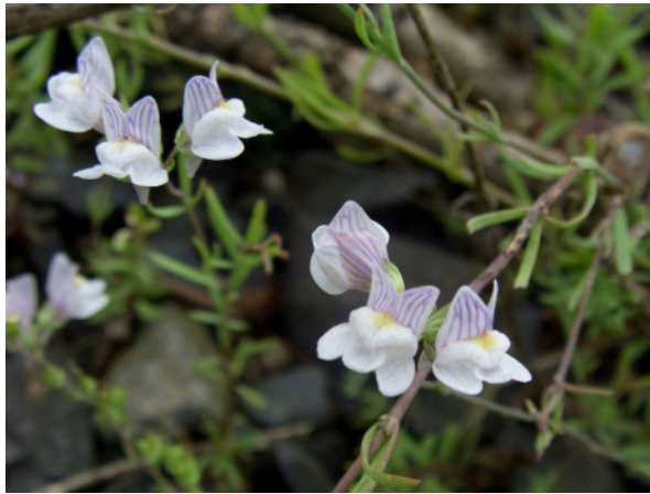
Abb. 7: Linaria repens auf einer Bahnbrache in Bochum-Dahlhausen (2008).

HER-Crange (4409/31): 2 Ex. auf einer Brachfläche in der Nähe des Rhein-Herne-Kanals, 01.09.2008, PG.