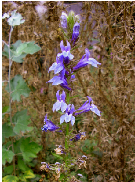
Abb. 8: Lobelia siphilitica auf einer Brache am Rhein-Herne-Kanal in Crange (2008).