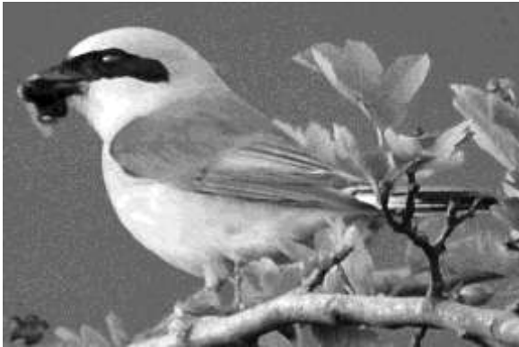
Abb. 9: Eine Leitart für verbuschte Saumbereiche – der Neuntöter ( Lanius collurio )

lerietum pyramidatae [Knapp 1942]). In den in Randbereichen verbliebenen Gebüsch findet der Neuntöter ( Lanius collurio ) geeignete Brutbedingungen (Abb. 9).