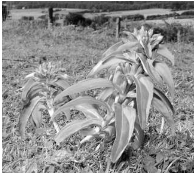
Abb. 8: Das Aushängeschild der Kalktriften – der Kreuz-Enzian ( Gentiana cruciata )

Im dritten Jahr nach der Entbuschung gelang auf den sich entwickelnden Flächen der Nachweis von 14 Pflanzenarten, die in der Roten Liste geführt oder durch das Bundesnaturschutzgesetz geschützt sind, darunter Acker-Wachtelweizen ( Melampyrum arvense ), Stattliches Knabenkraut ( Orchis mascula ), Fliegen-Ragwurz ( Ophris insectifera ). und Sonnenröschen ( Helianthemum nummularia agg.). Vor allem aber sind es die Enziane, namentlich der Kreuz-Enzian ( Gentiana cruciata ), Deutscher Enzian ( Gentianella germanica ) und Fransen-Enzian ( Gentianella ciliata ), die das Wesen der Kalktriften ausmachen (vgl. Abb. 8).