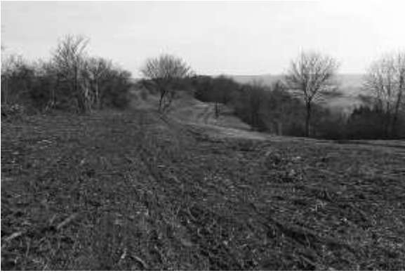
Abb. 3: NSG „Kalktriften Willebadessen“, „Gerlan“ im Winter 2008 / 2009

Die Zeit ist nicht stehen geblieben. Schaut man sich den Gerlan oder den Schleusenberg genauer an, fallen größere frisch entbuschte Bereiche und ausgedehnte Rohbodenflächen auf (vgl. Abb. 3). Deutlich sind Spuren schwerer Geräte zu erkennen, die andeuten, dass hier vor kurzem noch ein anderes Bild der Landschaft vorherrschend war und dass es viel Kraft und Zeit gekostet hat, den heutigen Zustand wieder herzustellen.