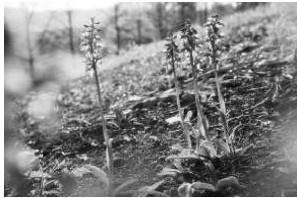
Abb. 7: Bereits kurze Zeit nach der Entbuschung kommen wieder Orchideen zur Blüte wie hier das Stattliche - Knabenkraut ( Orchis mascula )

als 10 ha Kalk-Halbtrockenrasen entbuscht und nachgepflegt werden. Um die Auswirkungen der durchgeführten Maßnahmen und der Beweidung durch Schafe darzulegen, wurde im selben Jahr ein umfangreiches Monitoring durchgeführt, welches die wertbestimmenden Kalkmagerrasen-Arten und ihre Individuenzahlen erfassen sollte. Die Ergebnisse unterstrichen die hohe natur-schutzfachliche Wertigkeit der Kalktriften.