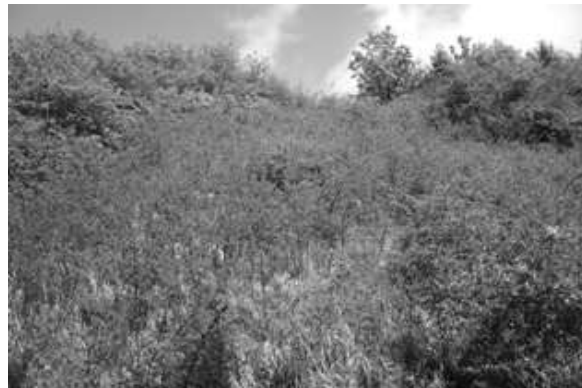
Abb. 4: Verbuschter Magerrasen auf den Kalktriften 1999

In den 1980er Jahren wurde durch BEIL (1980) sowie ALBRECHT & LETSCHERT (1985) der schlechte Zustand der schutzwürdigen Landschaft beschrieben. Sie forderten dringend Pflegemaßnahmen zum Erhalt der wertvollen Lebensräume und Arten. BEIL (1980) sah dabei die einzigartige Insektenfauna bereits „kurz vor der endgültigen Vernichtung!“ Fast überall war ein drastischer Rückgang der typischen Pflanzen- und Tierarten zu verzeichnen. Lediglich auf wenigen noch extensiv mit Pferden beweideten Flächen konnte eine noch weitgehend intakte Flora und Fauna vorgefunden werden (LANDSCHAFTSSTATION 1999). Nach ALBRECHT & LETSCHERT liefen bereits seit 1982 Verfahren zur Ausweisung als Naturschutzgebiet. Trotzdem sollte es noch fast 20 Jahre dauern, bis Maßnahmen zur Erhaltung bzw. Wiederherstellung dieses Gebietes eingeleitet wurden.