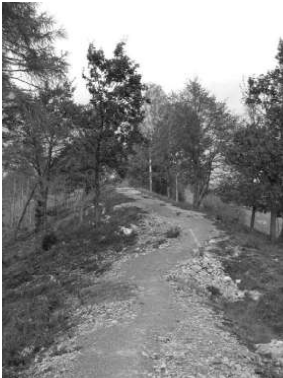
Abb. 10: „Falterpfad“ am Schleusenberg

Zusätzlich werden zahlreiche Schautafeln über Spannendes aus der Biologie der heimischen Schmetterlinge informieren.