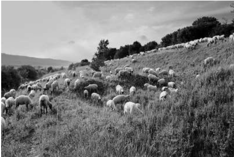
Abb. 1: Schafe im NSG „Kalktriften bei Willebadessen“, Teilfläche „Hanjörn“