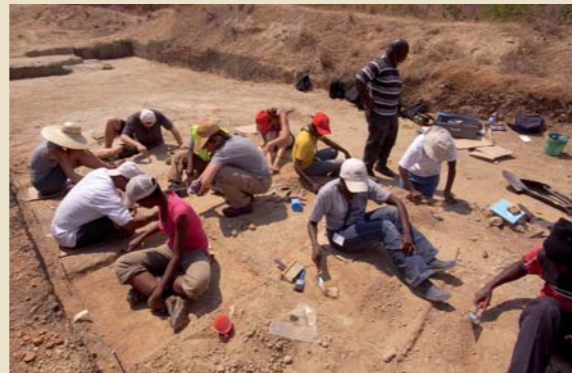
ZIAF Jahresbericht 2012