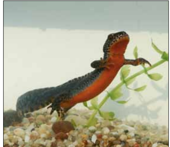
Abb. 1: Bergmolch-Männchen aus der Pfütze auf dem Waldweg im Kiefernforst (Abt. 2680/2684) nördlich Göritz (Aquarienaufnahme am Fundort, 05.04.2010).

Aus dem Bereich des Hohen Flämings im angrenzenden Bundesland Brandenburg waren seit längerem Bergmolchvorkommen im Planetal bei Raben und Umgebung bekannt. Einen Überblick