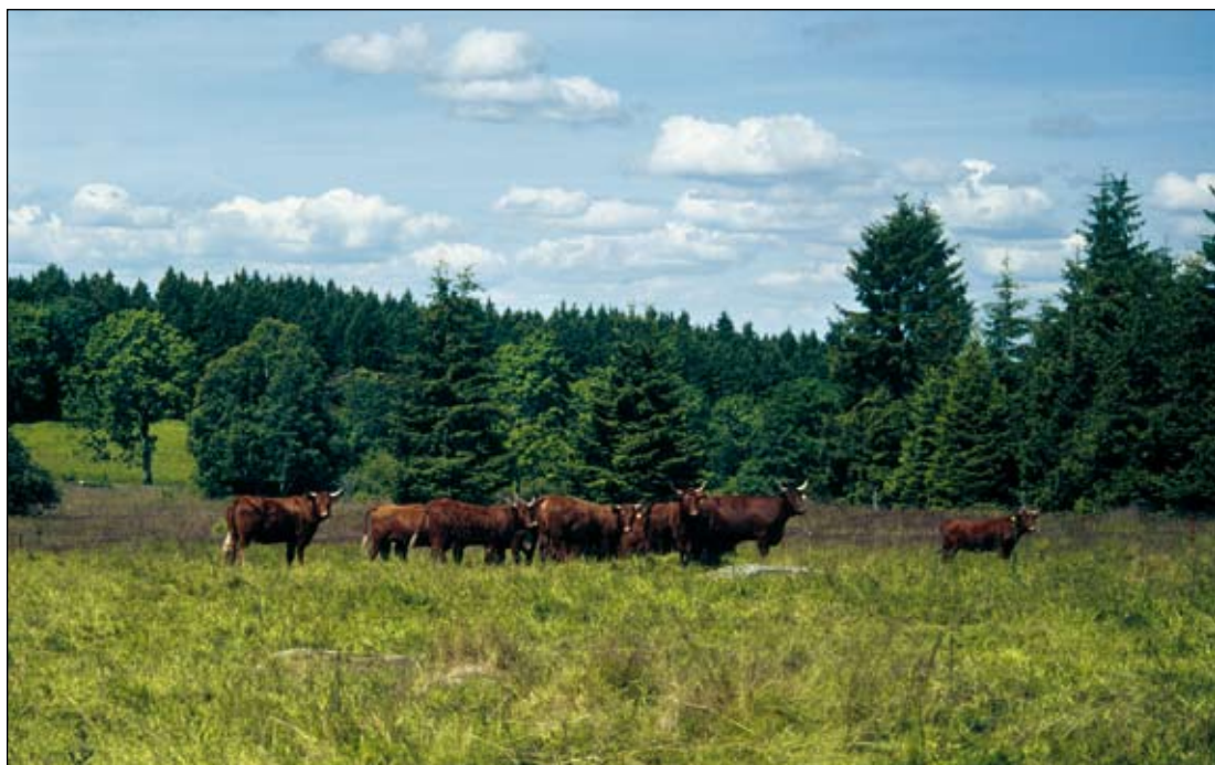
Abb. 5: Optimale Nutzung mit Rindern auf einer Arnika-Wiese im Nationalpark Harz im Jahr 2000.

gestaltete sich außerdem der schnelle Aufwuchs der Himbeere als hinderlich (SCHEIDEL & BRUELHEIDE 2004).