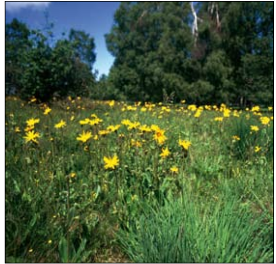
Abb. 1: Arnikafläche in voller Blüte bei Stiege.

Für den Naturschutz ist Arnika nach wie vor eine Leitart. Sie ist als Pflanzenart von gemeinschaftlichem Interesse in Anhang V der FFH-Richtlinie