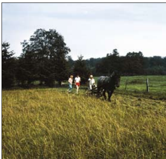
Abb. 3: Heumahd auf der Arnika-Versuchsfläche im Jahr 1988.