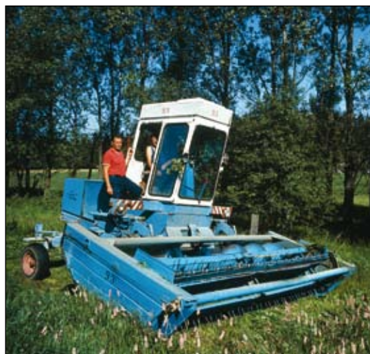
Abb. 4: Ungeeignete Mähtechnik auf benachbarten Arnika-Wiesen im Jahr 1988.

bedingungen und erhöhte diese Anzahl bis 1985 auf 35. Im Jahr 1988 folgte ein rapider Rückgang auf 9 Pflanzen und schließlich ab 1996 wieder ein leichter Anstieg auf 14 bis 25 Blattrossetten. Beim Pflanztrupp 7 trat der seltene Fall ein, dass die Rosettenbildung von einer Pflanze ausging, der Bestand wuchs dann von 1984 über 5 Exemplare auf 13 Exemplare (1987) an und entwickelte sich dann bis 1996 langsam wieder zurück. Von 7 Pflanztrupps des Jahres 1982 blieb ab 1996 lediglich ein Trupp bestehen, der sich wie in Tabelle 3 dargestellt, entwickelte.