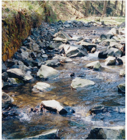
Abb. 6: Naturlehrpfad zum Thema Fließgewässer- und Fischartenschutz