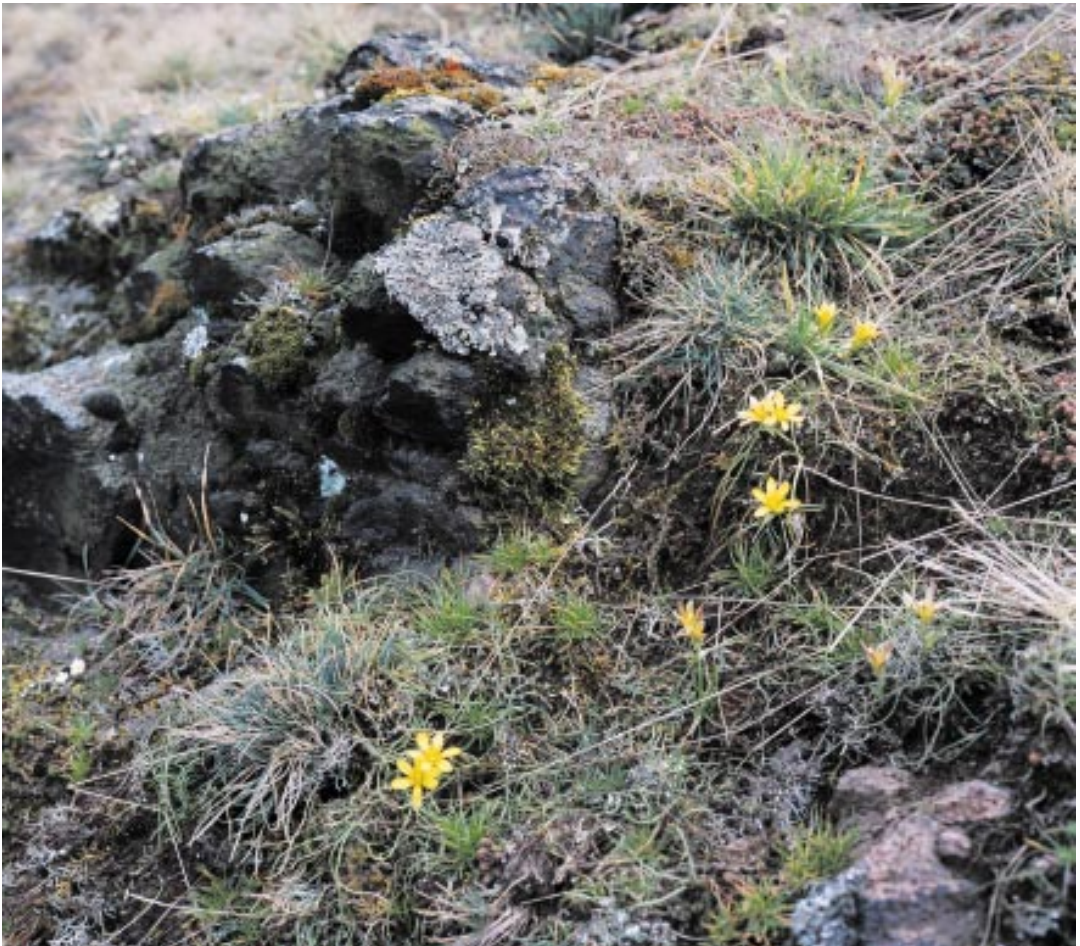
Felsen-Goldstern ( Gagea bohemica ) auf flachgründigem Silikatgesteinsboden im FFH-Gebiet Porphyrkuppenlandschaft nordwestlich von Halle

Auf flachgründigen, feinerdearmen Silikatgesteinsverwitterungsböden, die frühjahrsfrisch sind, vorkommend. Eine vorwiegend von einjährigen Pflanzen aufgebaute Pioniergesellschaft, die ihre Entwicklung bereits abgeschlossen hat, wenn die flachgründigen Grusstandorte im Frühsommer auszu-