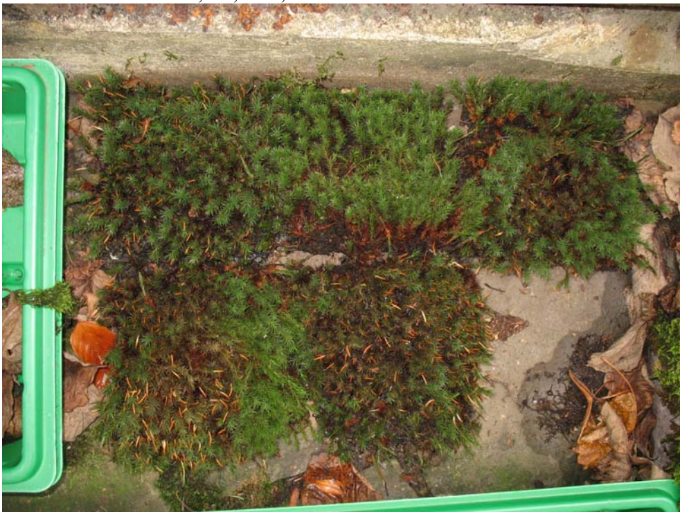
Abb. 6: Moosmatte mit Polytrichum juniperinum nach Hitzetest in feuchtem Zustand. Oben v.l.n.r. 30, 40, 50°C, unten 60°, 70°C.