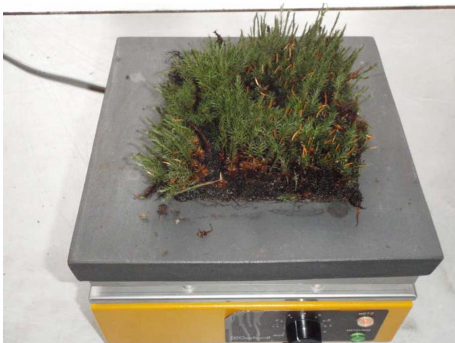
Abb. 4: Versuchsanordnung zu Hitzetoleranzversuchen mit Moosen

In dem vorliegenden Versuch sind im Gegensatz zu den früheren Publikationen die für die Mattenbegrünung verwendeten Arten auf Moosmatten getestet worden. Dazu wurden mit Polytrichum juniperinum als auch mit Ceratodon purpureus bewachsene Moosmatten in 10x10 cm Stücke zerschnitten und einzeln auf eine Wärmebank gelegt (Abb. 4). Die Temperatur der Wärmebank wurde so erhöht, dass die Oberflächentemperatur (mit einem IR-Thermometer gemessen) 30°, 40°, 50°, 60° und 70° betrug. Die Versuchsdauer betrug eine Stunde.