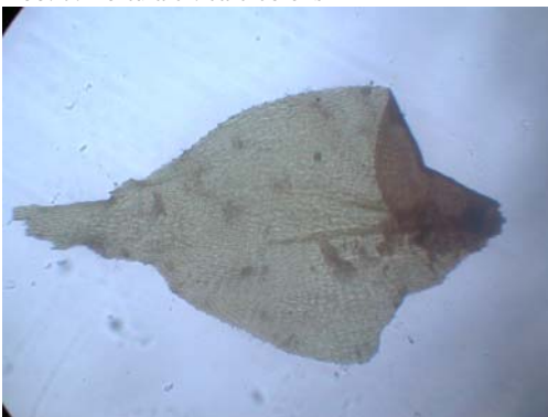
Abb. 9: Rhytidadelphus squarrosus