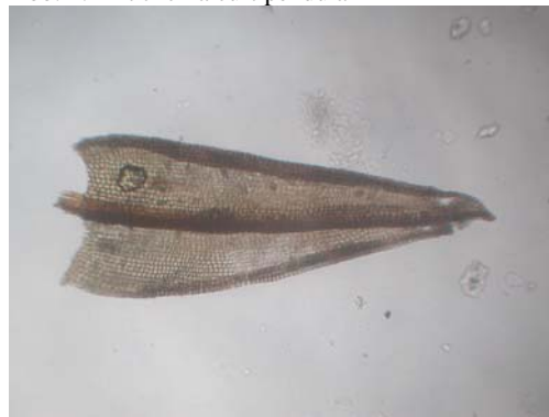
Abb. 6: Ceratodon purpureus