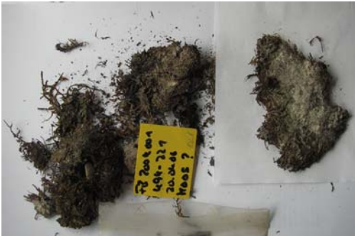
Abb. 1: Moosprobe aus Latrine