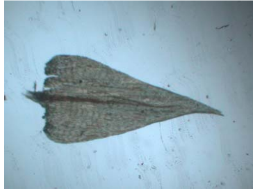
Abb. 8: Brachythecium rutabulum