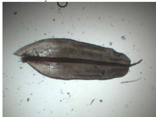
Abb. 10: Tortula ruralis