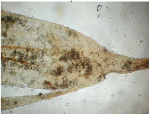
Abb. 5: Antitrichia curtipendula