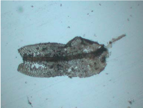
Abb. 7: Tortula cf. calcicolens