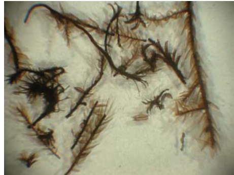
Abb. 2: Aufgeschwemmte Moose