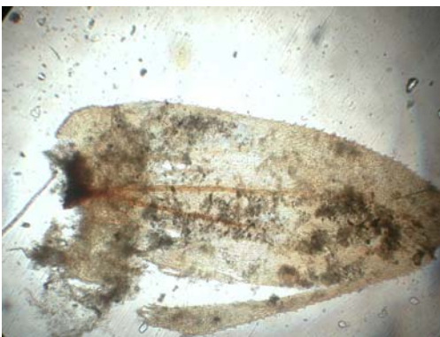
Abb. 3: Antitrichia curtipendula