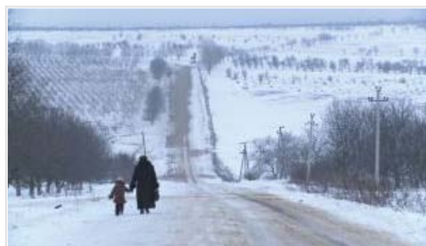
Wie von einem anderen Planeten und doch so nah: Nur wenige Meter hinter der EU-Außengrenze Rumäniens herrscht große Armut.