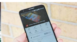
Google Drive will soon back up your phone's