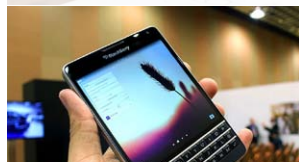
BlackBerry Passport and Classic come to AT&T on