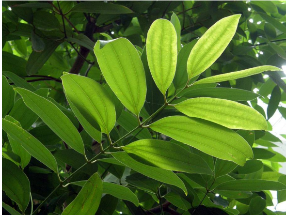
Abb. 13: Cinnamomum zeylanicum (Ceylon-Zimtbaum), Blätter (H. STEINECKE).

Kassia-Zimt ist billiger als Ceylon-Zimt und wird deshalb häufig in Backwaren etc. verwendet. Also auch im Sinne dieser gesundheitlichen Bedenken: Vorsicht beim sehr reichlichen Verzehr von Zimtsternen!