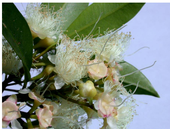
Abb. 8: Syzygium paniculatum (Kirschmyrte), Blüten (A. HÖGGEMEIER).