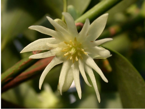
Abb. 9: Illicium anisatum (Japanischer Sternanis), Blüte der mit dem Echten Sternanis eng verwandten Art (A. HÖGGEMEIER).