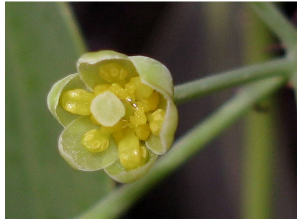
Abb. 16: Cinnamomum japonicum (Japanischer Zimtbaum), Blüte (A. JAGEL).