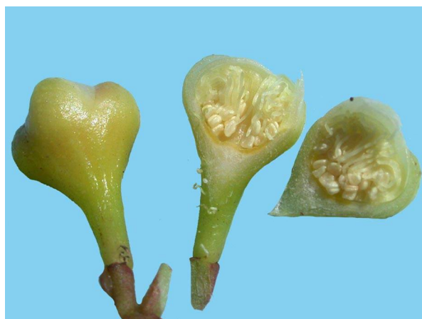
Abb. 7: Syzygium paniculatum (Kirschmyrte), frische Blütenknospen der mit der Gewürznelke nahe verwandten Art.

Die reifen Früchte werden als rot und fleischig beschrieben. Abb. 6 zeigt eine getrocknete Frucht und den freigelegten Samen.