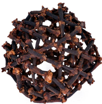
Abb. 1: Christbaumkugel aus Gewürznelken (D. MÄHRMANN).

Alle unsere Duft- und Gewürzstoffe sind solche sekundären Pflanzenstoffe. Die Pflanzen, die die drei hier behandelten typischen Weihnachtsgewürze liefern, sind kaum bekannt und hierzulande außer in Botanischen Gärten nicht zu finden. Und selbst hier findet man oft nur Verwandte. Wenn diese aber ähnlich genug sind, eignen Sie sich dazu, Bilder von ihnen hier und da in die Beschreibung der drei Weihnachtsgewürze mit einzubeziehen.