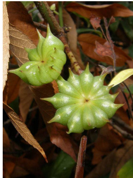
Abb. 12: Illicium henryi (Chinesischer Sternanis), junge Früchte am Baum (H. STEINECKE).