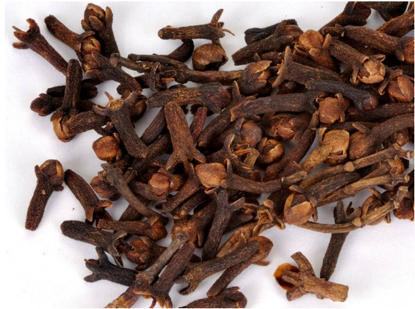
Abb. 4: Gewürznelken als Gewürz (D. MÄHRMANN).

Kultiviert werden Gewürznelkenbäume heute weit über ihr Ursprungsgebiet hinaus bis nach Madagaskar und die Tropen Amerikas.