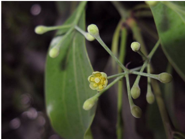
Abb. 15: Cinnamomum japonicum (Japanischer Zimtbaum), Blütenstand (A. JAGEL).