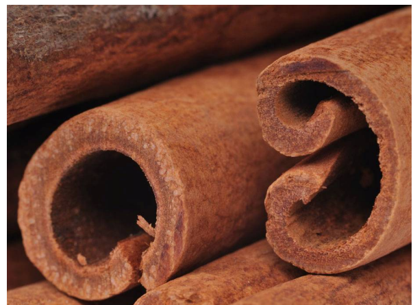
Abb. 18: Zimtstangen, Detail (D. MÄHRMANN).