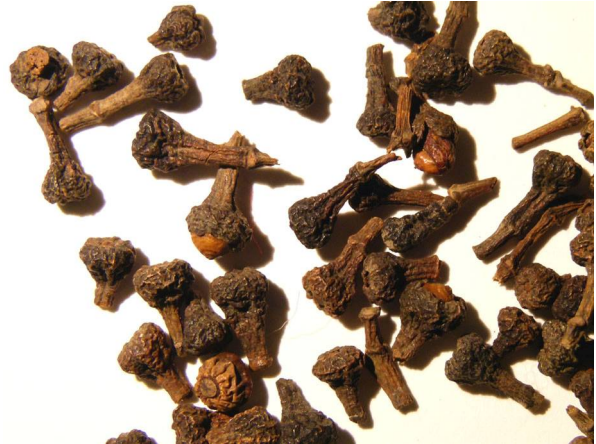
Abb. 14: Cinnamomum zeylanicum (Ceylon-Zimtbaum), getrocknete "Zimtblüten" (H. STEINECKE).