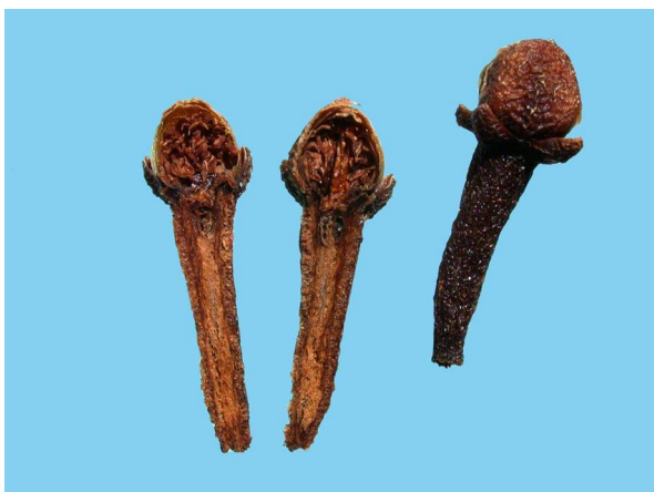
Abb. 5: Syzygium aromaticum (Gewürznelke), getrocknete Blüten, links aufgeschnitten (A. HÖGGEMEIER).

Für die Pflanzenfamilie der Myrtaceae ist das Vorkommen von ätherischen Ölen charakteristisch, man denke an Eucalyptusöl (aus div. Arten der Gattung Eucalyptus ) oder an Teebaumöl (von Melaleuca alternifolia ). Bei Syzygium aromaticum handelt es sich insofern um einen Sonderfall, da es sich hier um ein Blütengewürz handelt. Ätherische Öle befinden sich wohl in allen Teilen des Baumes, in höchster Konzentration aber in den ungeöffneten Blütenknospen kurz vor dem Aufblühen. In dem den Fruchtknoten umgebenden Gewebe (Hypanthium) befinden sich reichlich Öldrüsen. Die Knospen werden nach dem Pflücken durch Trocknen in der Sonne oder am Feuer konserviert und gelangen so in den Handel.