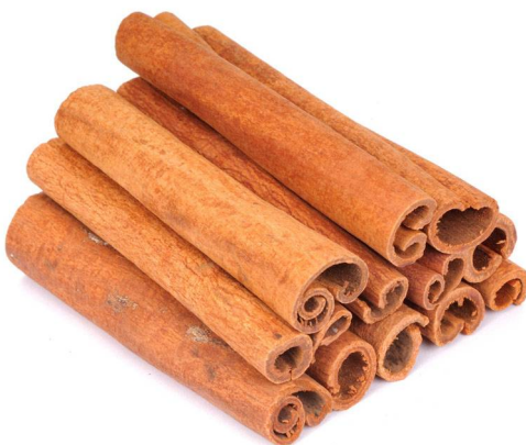
Abb. 17: Zimtstangen (D. MÄHRMANN).