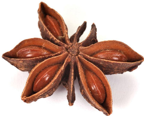
Abb. 11: Illicium verum (Echter Sternanis), reife Sammelbalgfrucht mit Samen: fünf Fruchtblätter mit Samen, drei verkümmert (D. MÄHRMANN).