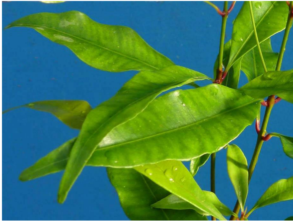
Abb. 3: Syzygium aromaticum (Gewürznelke), Blätter (A. HÖGGEMEIER).

Bei "Nelken" im Sinne von Gewürznelken handelt es sich um die getrockneten Blütenknospen des Myrtengewächses Syzygium aromaticum , die im Ganzen und gemahlen angeboten werden. Die Heimat des Gewürznelkenbaumes sind die tropischen Molukken-Inseln Indonesiens, auch als "Gewürzinseln" bekannt. Es handelt sich um 10-12 m hohe Bäume mit glänzenden, immergrünen, zugespitzt ovalen Blättern, die an Ficus benjamina , die bekannte Birkenfeige aus dem Wohnzimmer, erinnern. Die Blätter des Nelkenbaumes sind allerdings gegenständig (Abb. 3).