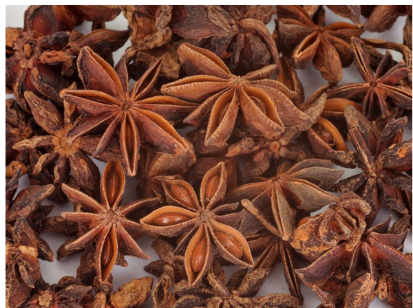
Abb. 2: Sternanis als Gewürz und Dekoartikel (D. MÄHRMANN).