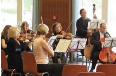
Musiker der Sinfonietta Hofheim

Festakt und Symposium zur Rückschau auf 23 Jahre akademische Tätigkeit an der Goethe-Universität