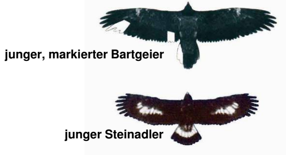
junger, markierter Bartgeier

Bartgeier sind mit rund 2,90 m Spannweite größer als Steinadler. Wichtigstes Erkennungsmerkmal ist der lange, spitz zusammenlaufende (keilförmige) Stoß. Gänsegeier sind in Österreich nur im Sommer anzutreffen (Ausnahme: Salzburg Umgebung) und haben einen kurzen, rundlich gefächerten Stoß. Junge, freigelassene Bartgeier besitzen in den ersten Jahren individuelle, längliche Markierungen.