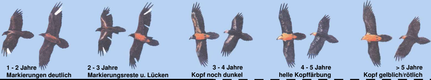
1 - 2 Jahre Markierungen deutlich

Grafiken: El Quebrantahuesos en los Pireneos (R. Heredia y B. Heredia); Ministerio de Agricultura Pesca y Alimentación. Publicaciones del Instituto Nacional para la Conservación de la Naturaleza, 1991