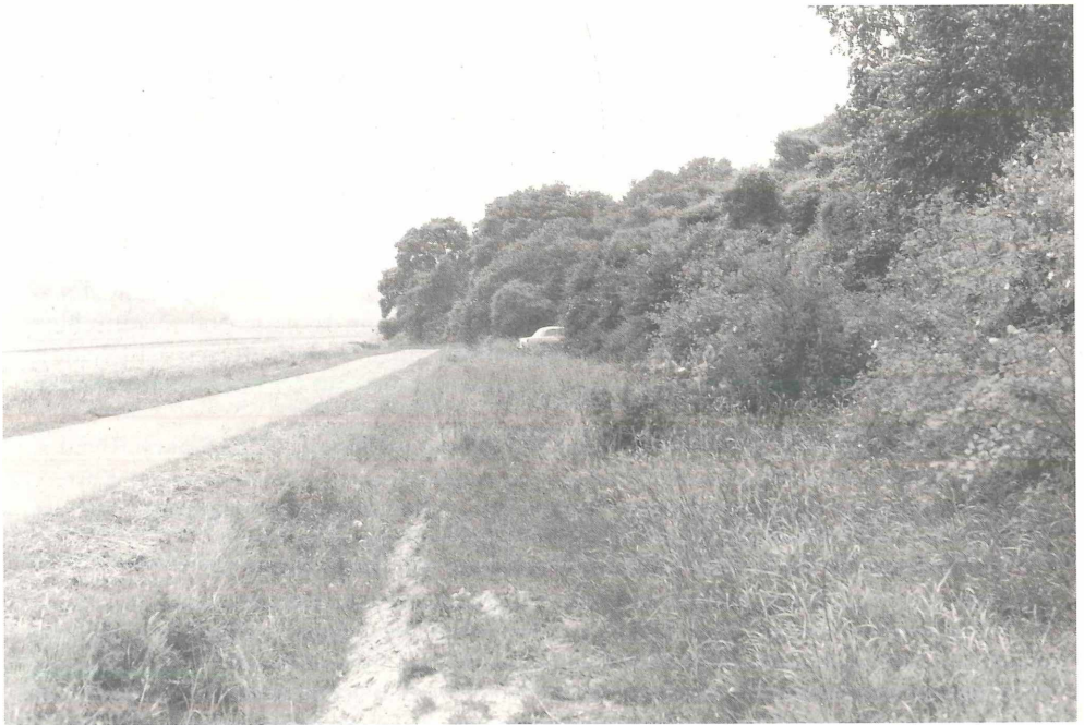
Abb. 2: Zustand des Kurricker Berges (Südhang) um 1970.