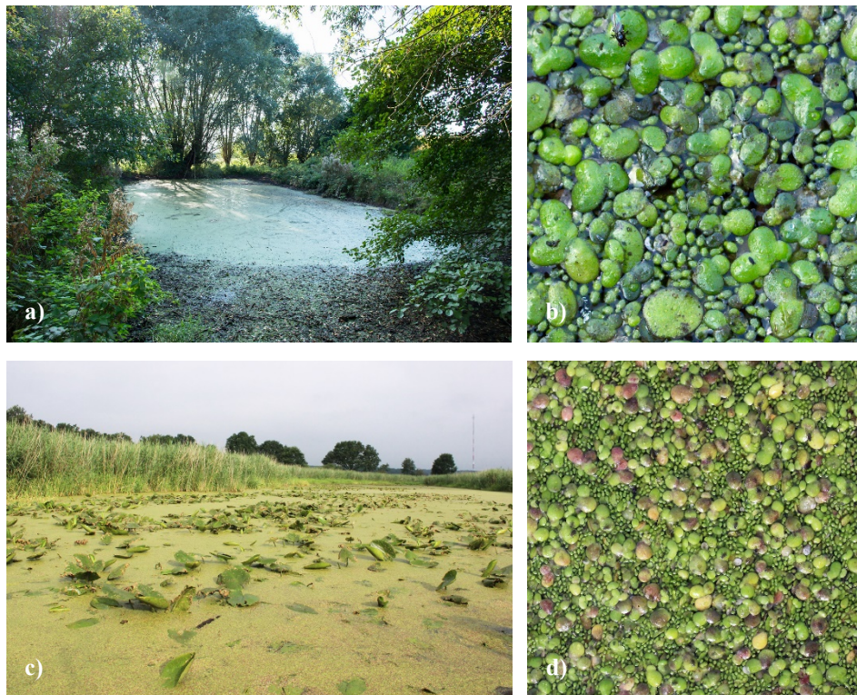
Abb. 3. a) Probenahmestelle UE 01: aspekt bei herbstlichem Niedrigwasserstand mit Blick auf den beschatteten Wasserlinsen-Schwimmteppich aus Lemna gibba, Spirodela polyrhiza und Wolffia, b) die mikroskopische Nachbestimmung ergab einen Mischbestand aus W. columbiana (mehrheitlich) und W. arrhiza, c) Probenahmestelle DAN 03: Restorfer See in der Elbtal-aue, aufgrund der Nährstoffeinträge umliegender intensiv genutzten Ackerflächen existiert eine dicke Faulschlammschicht, d) die geschlossene Wasserlinsendecke besteht aus Lemna minor, L. gibba, Spirodela polyrhiza und Wolffia columbiana.