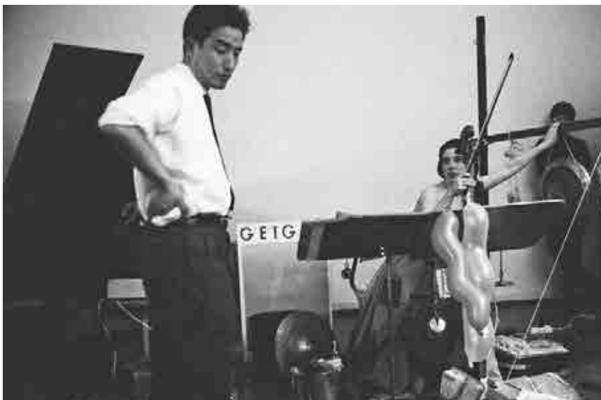
2 Die Fotografie von Inge Werth zeigt Nam June Paik und Charlotte Moormann 1965 bei einem Fluxuskonzert in der »studiogalerie«.