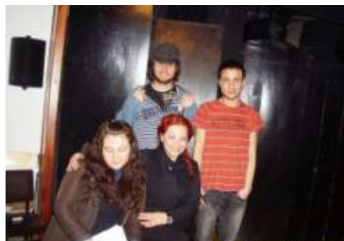
Abb.2: Auflockerung durch Gruppenmitglieder