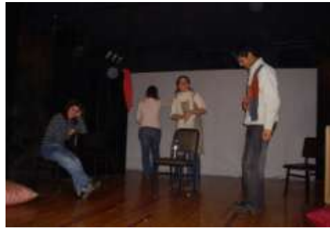
Abb.6: Üben im Theaterraum