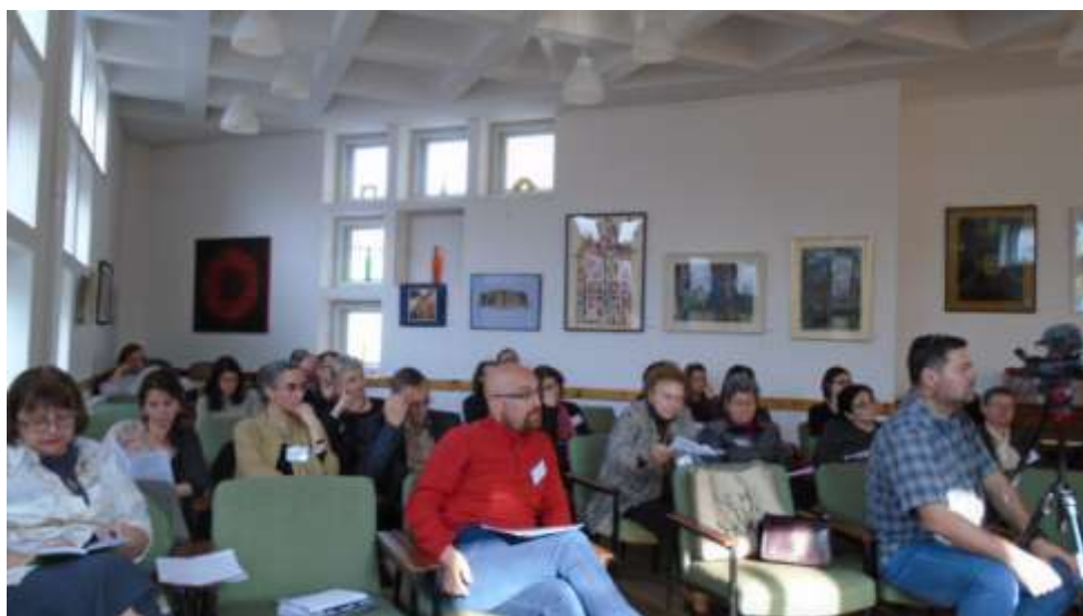
(Ein Foto von einigen Tagungsteilnehmern beim ersten Vortrag der Tagung von Pfarrer Peter Klein)

Petersberg/Sânpetru sprach über Luthers Verständnis von Psalm 37, der in der gegenwärtigen Zeit auch als Ermahnung an die Wohlstandsbürger des heutigen Rumäniens gelesen werden könne.