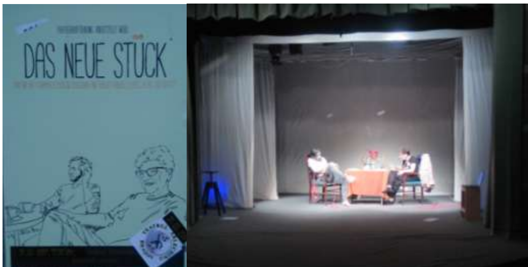
(Das Plakat und eine Szene vom Studententheater: Das neue Stück. Theaterperformance mit und von Duo Bastet)