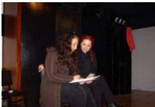
Abb.1: Besprechung mit einer Studentin