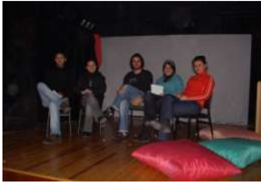
Abb.3: Gruppenmitglieder erarbeiten Themen