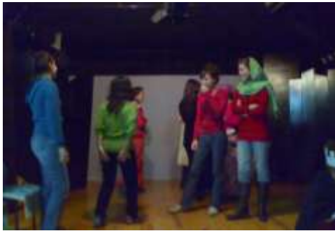
Abb.5: Erkundung des Theaterraumes