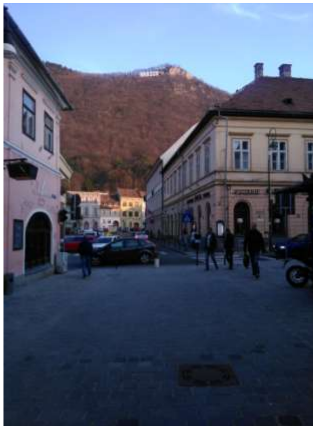
(Braşov / Kronstadt wird wegen seiner wunderschönen Lage direkt am Fuße des Tampa (967 m Höhe, Seilbahn) in den Südkarpaten auch das Rumänische Salzburg genannt. Die Stadt entstand am Schnittpunkt alter Kaufmannsstraßen nach Kleinasien, zur Adria, nach Mitteleuropa und nach dem Balkan.)

Das wissenschaftliche Interesse auf dem Gebiet der Germanistik ist in den letzten 30 Jahren in Rumänien, besonders nach der blutigen und gewaltsamen Wende, stark gestiegen. Die Germanistikabteilung der Philologischen Fakultät in Kronstadt/Braşov veranstaltete in Zusammenarbeit mit der Gesellschaft der Germanisten Rumäniens [GGR] (Zweigstelle Kronstadt) und mit dem Generalkonsulat der Bundesrepublik Deutschland in Hermannstadt zwischen dem 30. März und 01. April 2017 ihre XX. Internationale Tagung zum Thema Luthers Reformation und deren Wirkung auf Sprache, Literatur und Kultur .