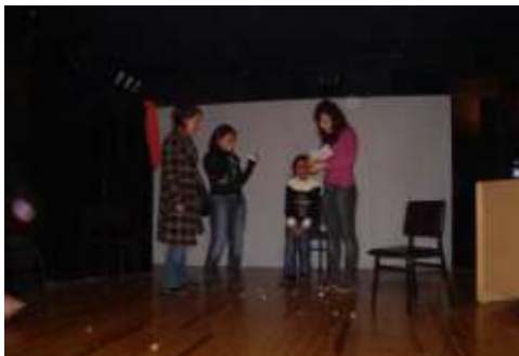
Abb.7: Vorbereitung im Theaterraum (1)