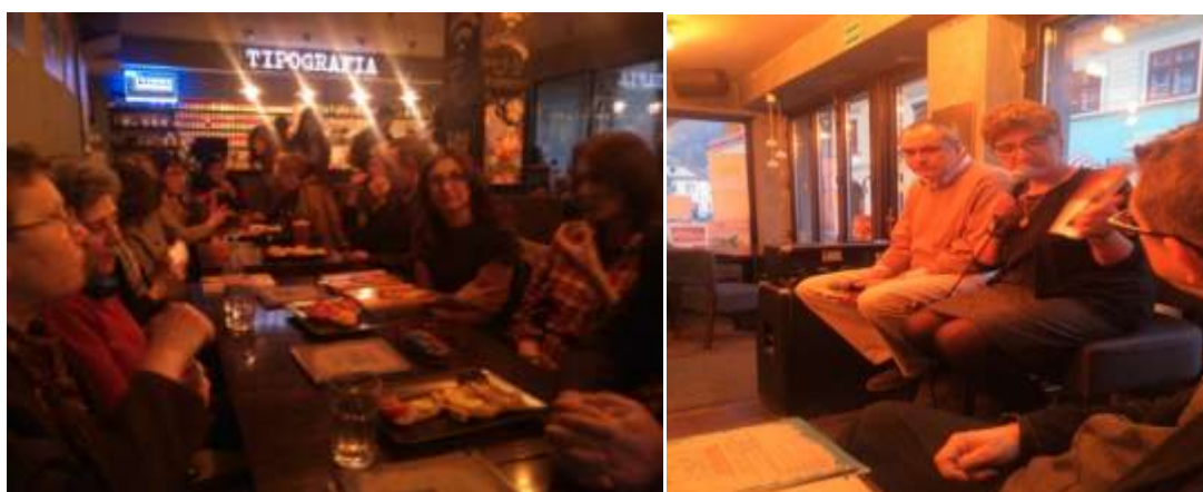
(Buchpräsentation: Eine der schönen Bars für Jugendliche oder Junggebliebene von Kronstadt/Braşov)