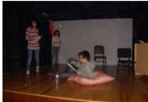
Abb.8: Vorbereitung im Theaterraum (2)