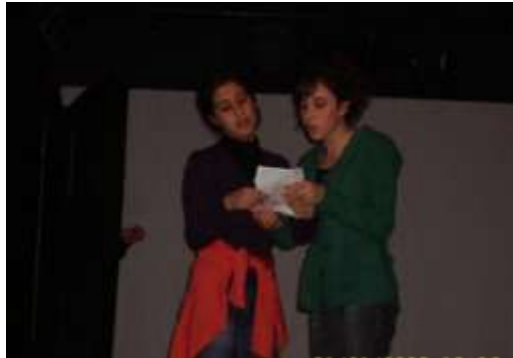
Abb.4: Studentischer Austausch