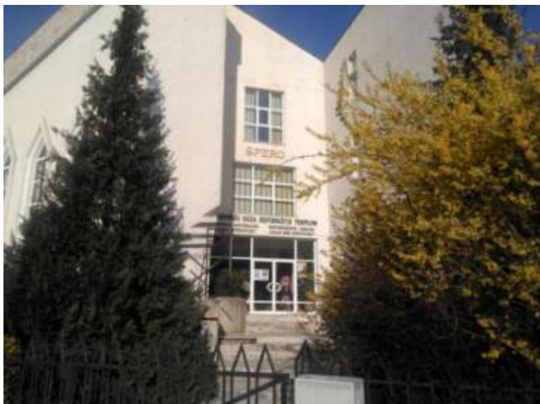
(Tagungsort: Gästehaus „Casa Speranței“ in der Moldova-Straße Nr. 2)