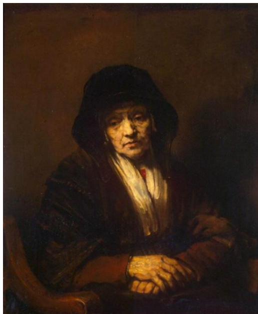
Figura 3: Rembrandt van Rijn, Retrato de uma velha senhora (1654) 14

A extrema acuidade de Aleksandr Sokurov com os aspectos plásticos da imagem rendeu-lhe a alcunha de “cineasta-pintor” 15 . Uma visada na filmografia do realizador russo só vem a confirmar essas afinidades eletivas entre o seu cinema e o domínio da pintura, seja buscando composições e distribuições de luz próprias a pintores como Rembrandt e Caspar David Friedrich, seja, de certa forma, prestando homenagem à própria história da pintura, através de filmes como A arca russa (2002), inteiramente rodado dentro do Museu do Hermitage, em São Petersburgo, e Elegia de uma viagem (2001), uma espécie de incursão afetiva pela história da pintura.