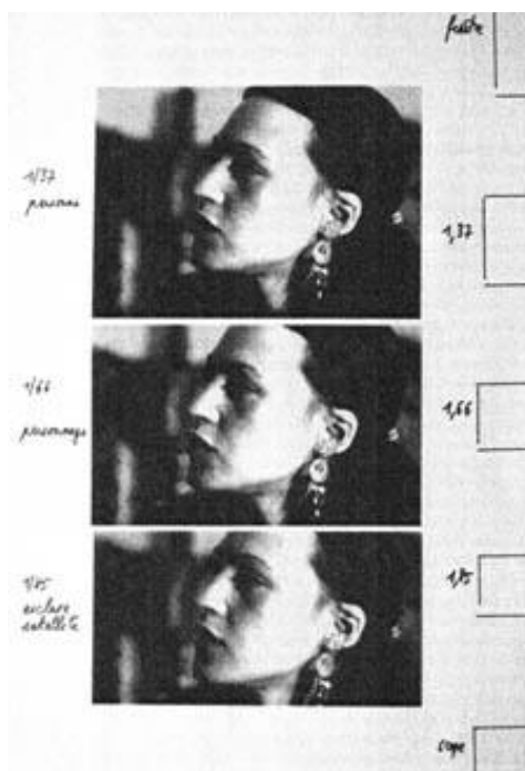
Figura 1: O mesmo fotograma do filme Notre Musique recortado em três tipos de janelas 8 .

No Fausto de Sokurov, essa visão exígua do espaço determina uma espécie de concentração de forças sobre a imagem; isto é, em vez de essas linhas de força se distribuírem centrifugamente do objeto focal para o espaço circundante, fazendo o nosso olhar buscar o que está no entorno, ela se concentra, centripetamente, no objeto focal, nos fazendo atentar aos seus volumes, texturas e luminosidades, tal como ocorre, por exemplo, nos planos fechados no rosto de Margarida, como nos mostra a imagem a seguir: