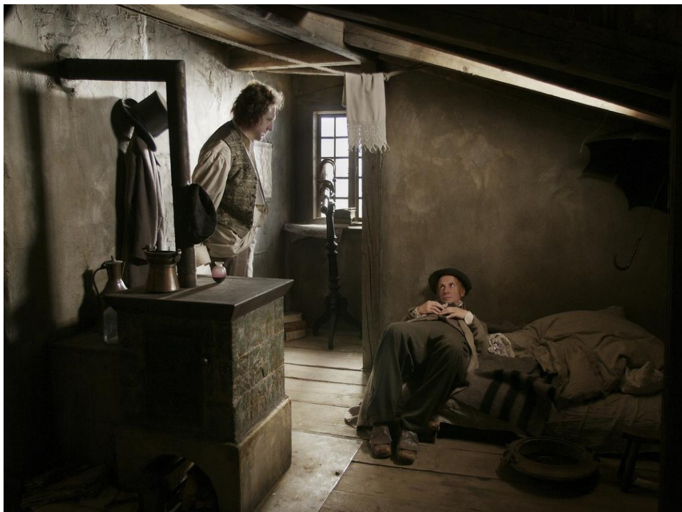
Figura 4: Fotograma do Fausto de Aleksandr Sokurov 16 .

No plano em destaque, que compõe uma das primeiras sequências do filme, Fausto recebe, em sua casa, a visita de Mefistófeles. Estamos diante de um plano aberto, em que a câmera, numa perspectiva diagonal, mostra o protagonista, em pé e de perfil, dirigindo seu olhar ao agiota, deitado no campo inferior da imagem. Há, aqui, duas fontes de luz visíveis no interior do plano: uma amarelada que emana de uma claraboia e ilumina a face de Mefistófeles, e outra que avança pela janela ao fundo, mais esbranquiçada. Apesar de a arquitetura, a mobília e o vestuário nos situarem, em termos de estilo, em um tempo distante, temos a impressão de que há, também, a reminiscência de um passado impressa na luz e na cor. Portanto, o desafio aqui se dá em fazer com que a iluminação do ambiente, a captação realizada pela câmera e o trabalho de coloração final consigam criar, através dos meios técnicos cinematográficos, um efeito próximo àquele obtido pelo pintor holandês através do pigmento sobre a superfície sólida. O esforço de Sokurov pode ser aproximado daquilo que Jacques AUMONT define da seguinte forma: “trabalhar a aparência plástica da imagem é sempre procurar modelar o material fotográfico para torcê-lo ‘no sentido do sentido’” (AUMONT 2004: 171). E o sentido buscado pelo realizador russo é aquele que sugira ao espectador uma experiência de imersão em um tempo passado a partir do modo como a luz se distribui