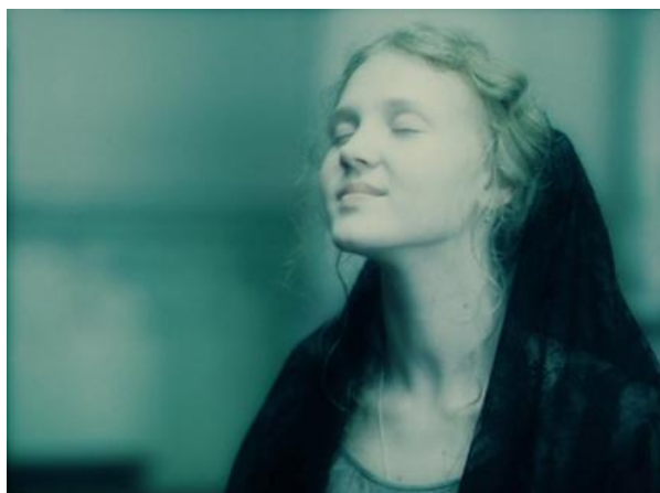
Figura 5: Fotograma mostra Margarida no interior de uma catedral 17 .

Essa abordagem claramente pictórica da composição, da luz e da cor, em Sokurov, impõe, ao material fílmico, efeitos análogos ao pigmento, à massa de tinta – ainda que tenham natureza qualitativa distinta – e, desse modo, somos remetidos a um tempo que não conhecemos através da fotografia ou do cinema, uma vez que os dispositivos que os tornam possíveis nem existiam, mas através das pinturas renascentista, barroca e romântica – para ficarmos nas concepções plásticas mais evidentes em Fausto . Esse trabalho de criação de uma luz atmosférica é diretamente responsável por um dos aspectos mais estonteantes do filme de Sokurov: as cores, como os fotogramas a seguir revelam: