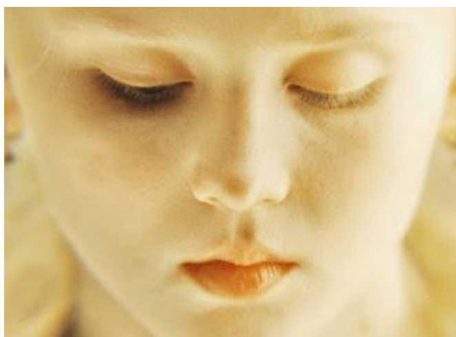
Figura 2: Fotograma do filme Fausto apresenta o rosto de Margarida em close-up 9 .

No Fausto de Sokurov, essa visão exígua do espaço determina uma espécie de concentração de forças sobre a imagem; isto é, em vez de essas linhas de força se distribuírem centrifugamente do objeto focal para o espaço circundante, fazendo o nosso olhar buscar o que está no entorno, ela se concentra, centripetamente, no objeto focal, nos fazendo atentar aos seus volumes, texturas e luminosidades, tal como ocorre, por exemplo, nos planos fechados no rosto de Margarida, como nos mostra a imagem a seguir: