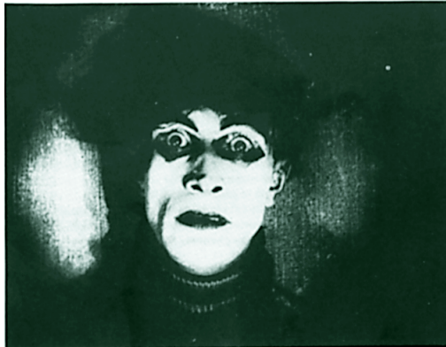
Abb. 1: Cesares weit aufgerissene Augen entsprechen Charcots Nosographie des »Somnambulismus« (aus: Robert Wiene: »Das Cabinet des Dr. Caligari«)

Die Geschichte in der Geschichte, die den bisherigen Verlauf der Binnenhandlung zu klären scheint, erweist sich als deutliche Referenz zu jenen »phantastische[n] Geschichte[n]«, 26 die der medizinische Diskurs im späten 19. Jahrhundert über das »hypnotische Verbrechen« produziert, und die sich der Film auf eine eigentümliche Art und Weise aneignet und transformiert. In zwischengeschalteten Rückblenden wird detailliert dargestellt, wie der Leiter der Irrenanstalt die »Zwangsvorstellung« 27 entwickelt, sich in die historische Figur des Caligari zu ver-