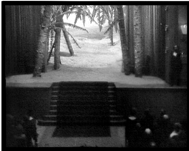
Abb. 3a+b: Meta-filmisches Moment in Fritz Langs »Dr. Mabuse, der Spieler« (1922): Sandor Weltmanns hypnotische Erzeugung visueller Halluzinationen als Kino